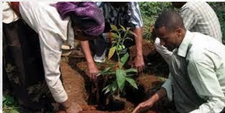
День посадки дерев - Єгипет, Мальта