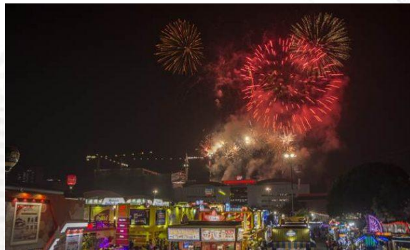
День моря й океану (Індонезія)