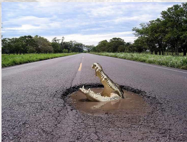
День вибоїни - Великобританія