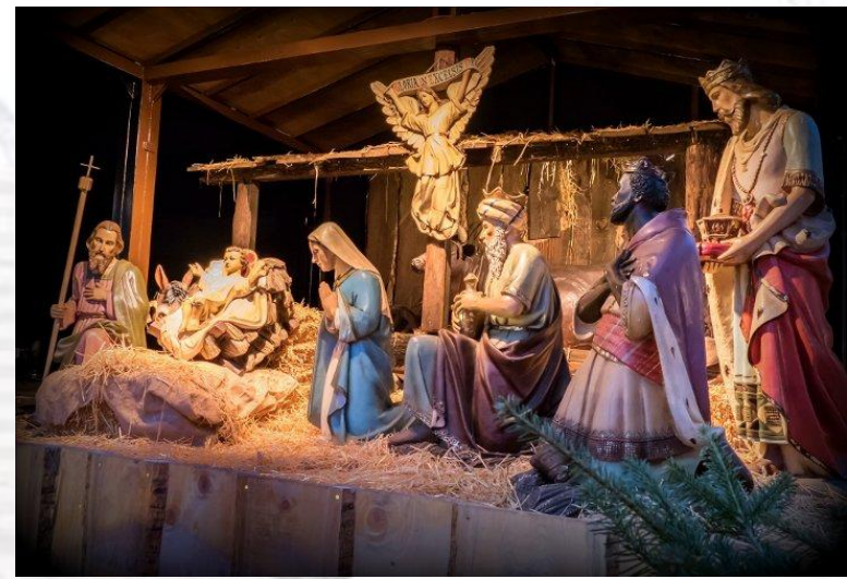
Фестиваль вертепів “Вертеп-фест” (Україна, Харків, 2022)