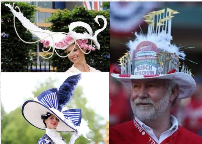
День капелюха (США)