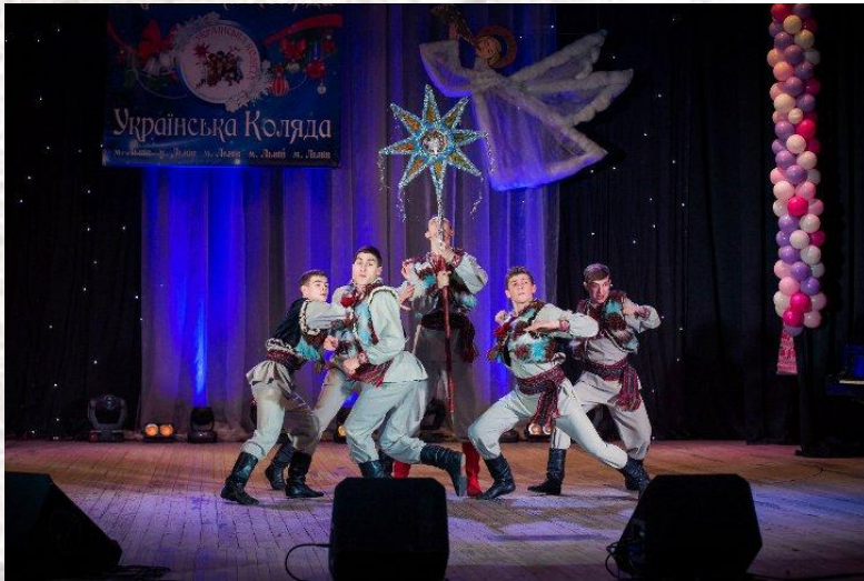
Фестиваль-конкурс “Українська коляда” (Україна, Львів, 2022)