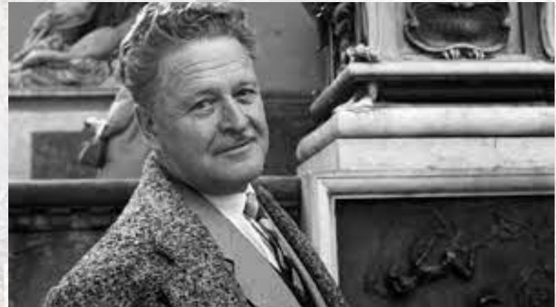
Поет, прозаїк, драматург, громадський діяч Назим Хікмет (1902-1963)