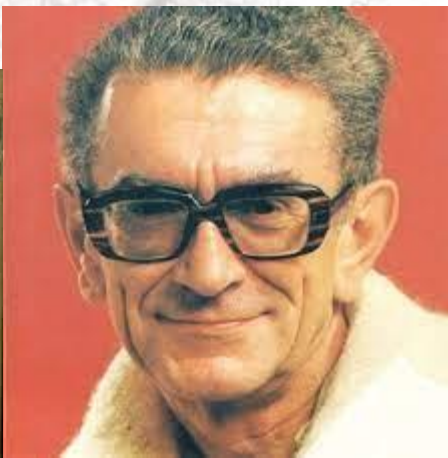
Письменник, поет, публіцист Януш Пшимановський (Польща, 1922-1998)