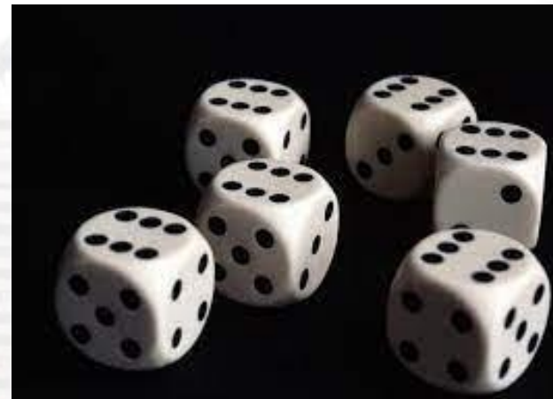
Дивовижний день збігів