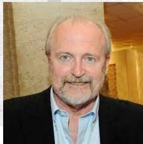
Кінорежисер Володимир Хотиненко (1952)