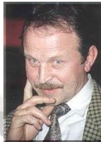
Музикант, керівник ансамблю «Червона рута» Анатолій Євдокименко (1942- 2002)