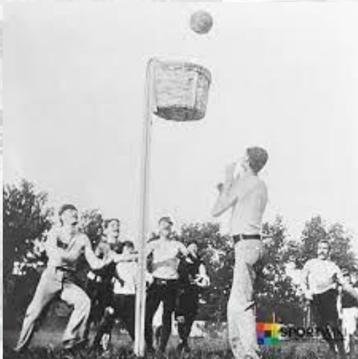
В Олбані, штат Нью-Йорк, зіграли першу офіційну баскетбольну гру(1892)