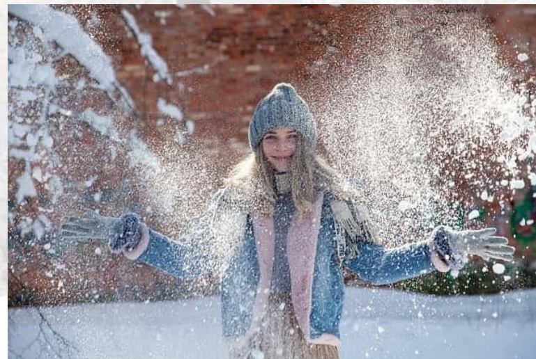
День прогулянки на свіжому повітрі