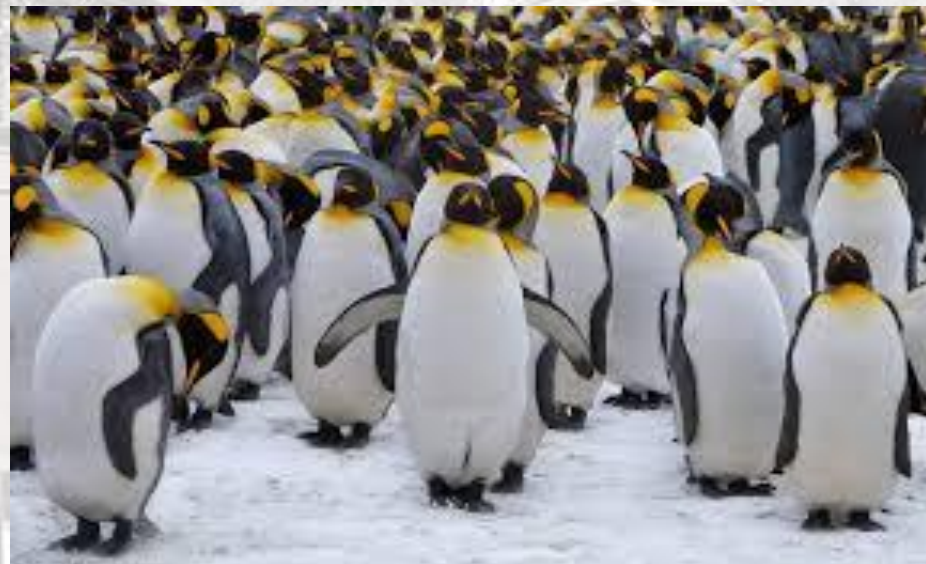
День поширення знань про пінгвінів