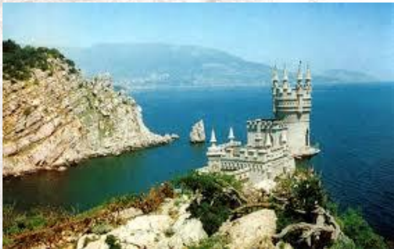
День Автономної Республіки Крим