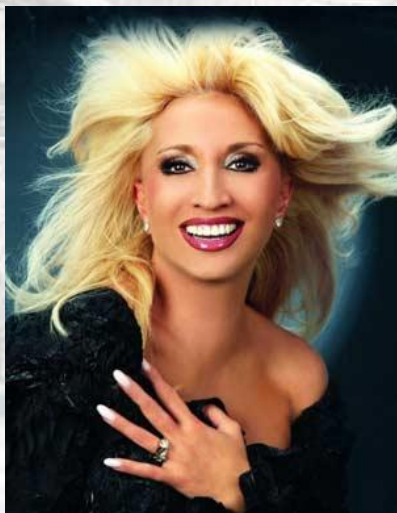
Співачка Ірина Аллегрова (1952)