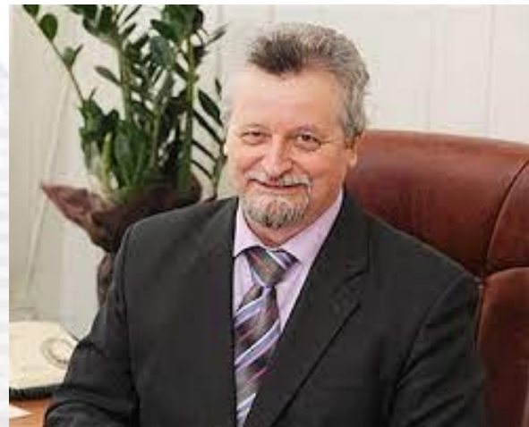
Нейрохірург, нейротрансплантолог, академік НАМНУ та НАНУ, професор Віталій Цимбалюк (1947)