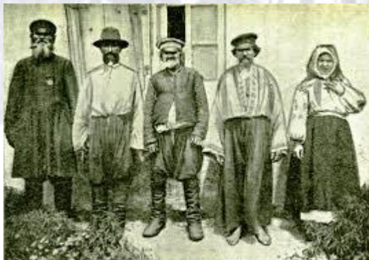
В Російській імперії розпочався перший загальний перепис населення (126,4 млн осіб, з яких 22,6 млн українців) (1897)