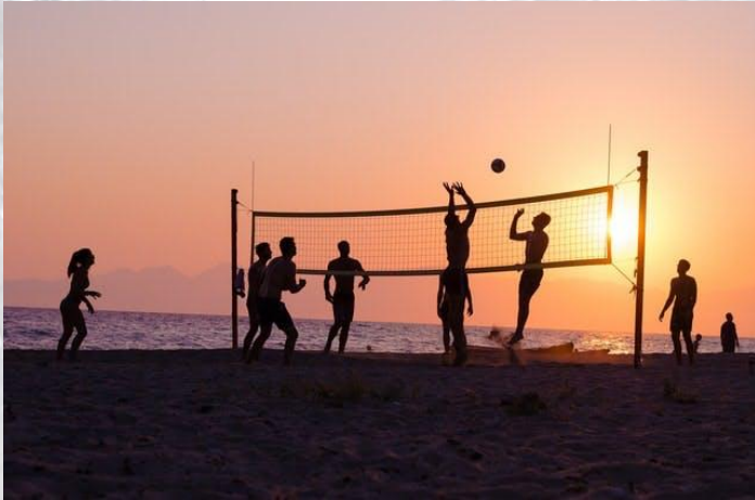
День народження волейболу