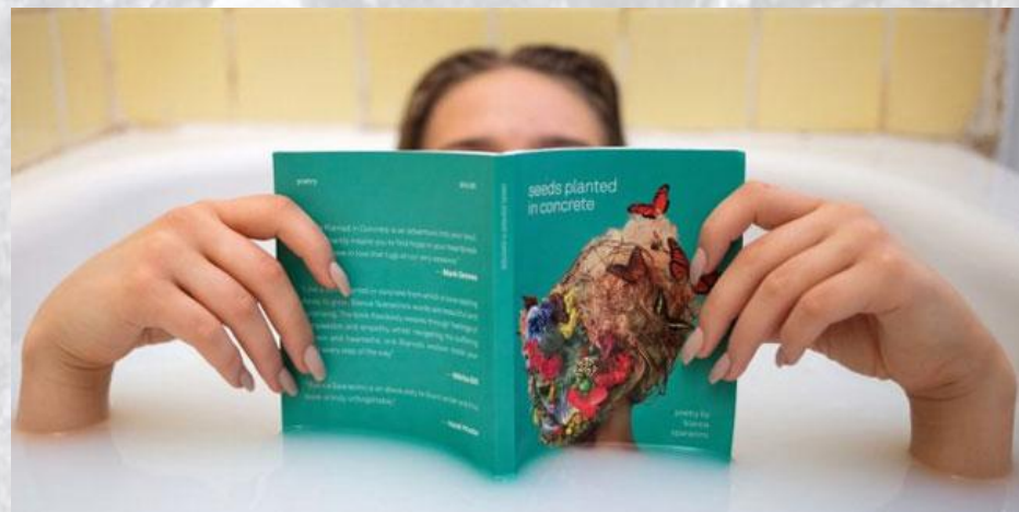
День читання в ванній (США)