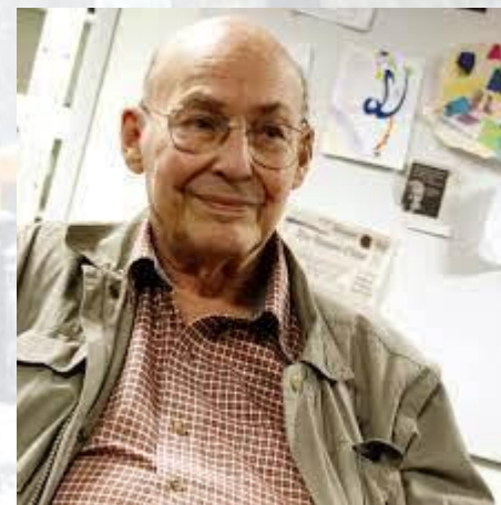
Вчений, дослідник в галузі штучного інтелекту Марвін Лі Мінський (США, 1927-2016)