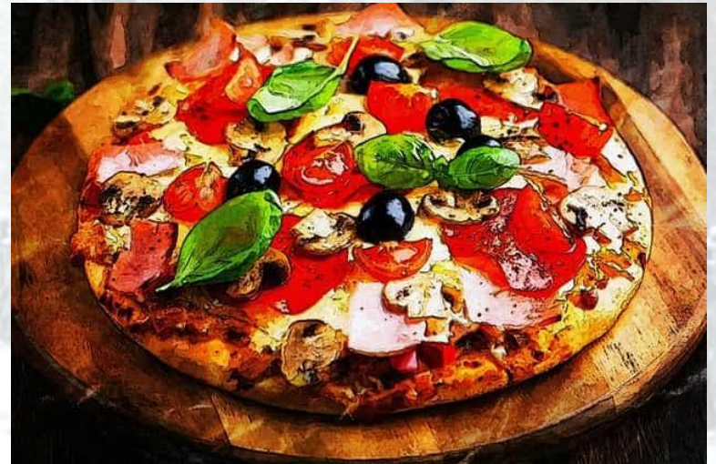
Міжнародний день піци