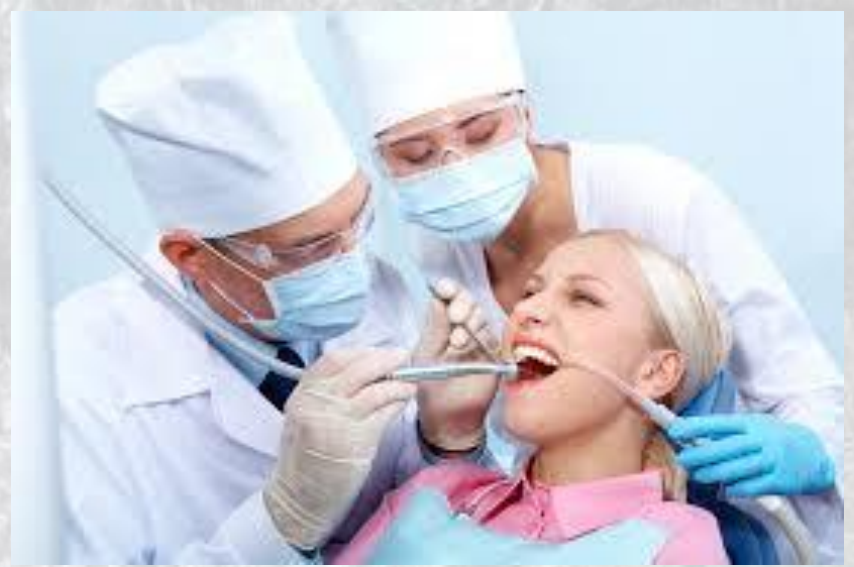
Міжнародний день стоматолога