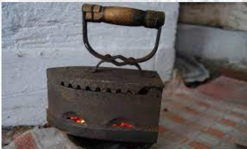
День народження праски