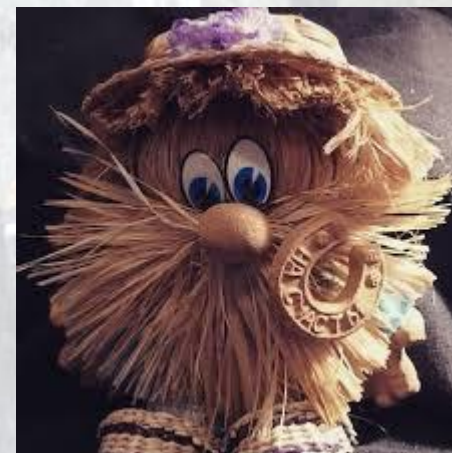
День пригощання Домового (Кудеси) та Велесичі