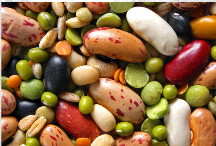
Всесвітній день зернобобових культур