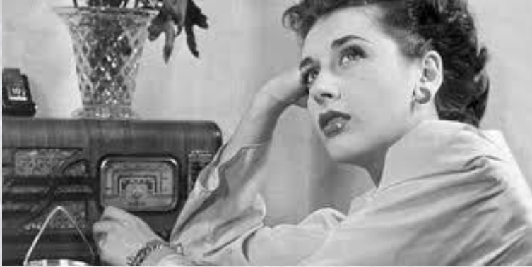
Всесвітній день радіо