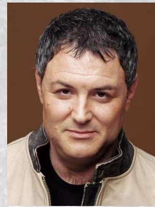
Музикант, співак, актор, колишній соліст біт-квартету «Секрет» Максим Леонідов (1962)