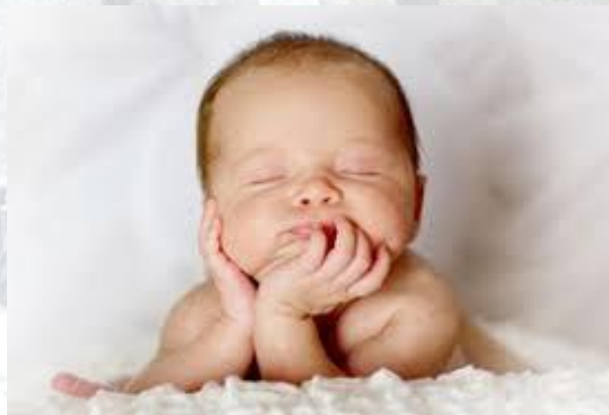
День солодких снів