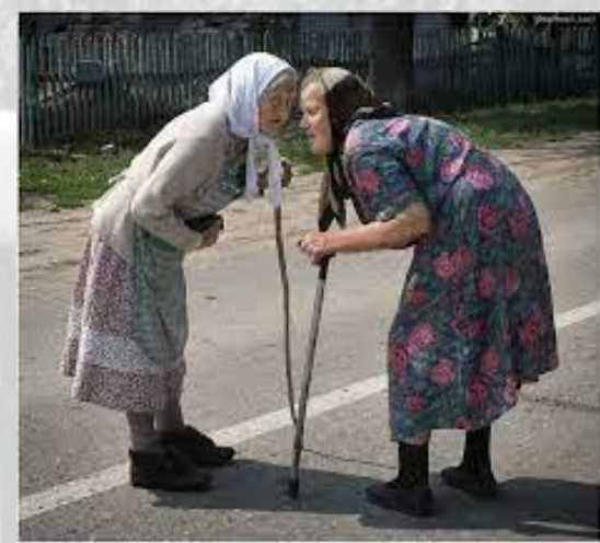
День жіночої дружби або День подруг