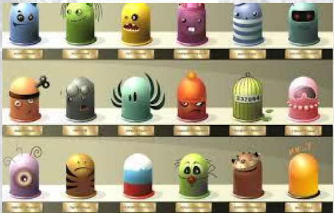
Міжнародний день презирватива