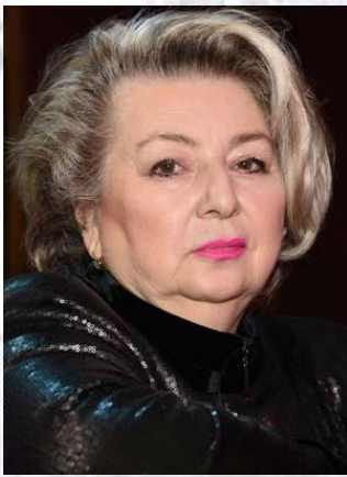
Тренер із фігурного катання Тетяна Тарасова (1947)