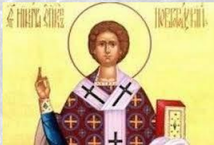
День пам'яті святителя Микити, затворника Печерського