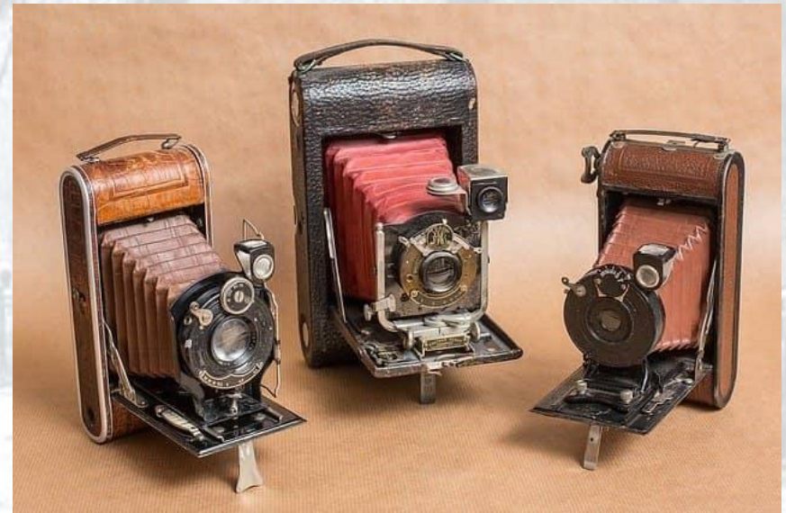
День народження кінокамери