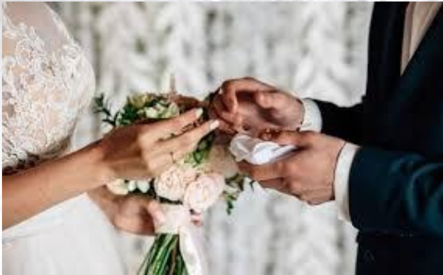
Всесвітній день шлюбу