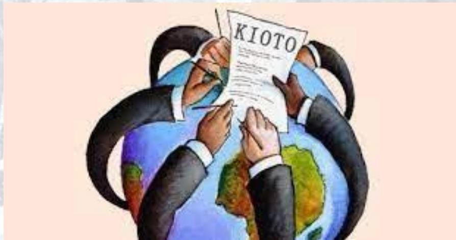
День Кіотського протоколу