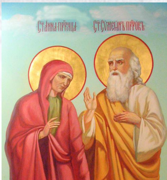
День пам'яті праведних Сімеона і пророчиці Ганни