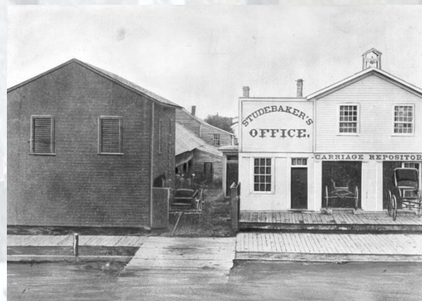
У США засновано фургонобудівну компанію братів Студебекерів - попередницю відомого автомобільного виробника (1852)