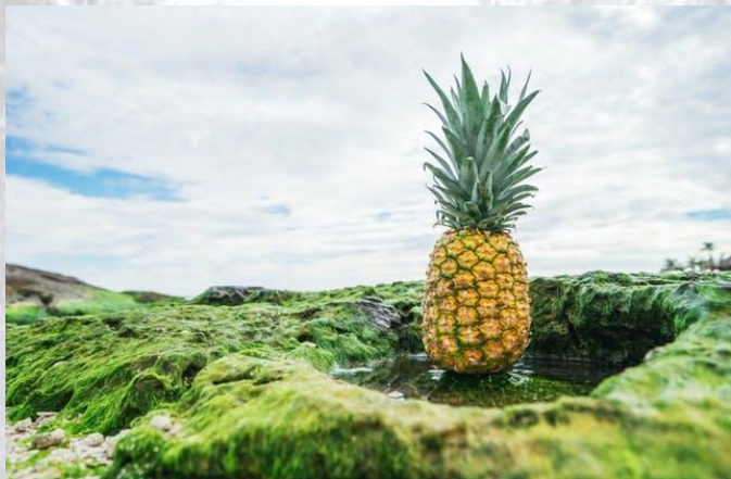
День свіжого ананасу