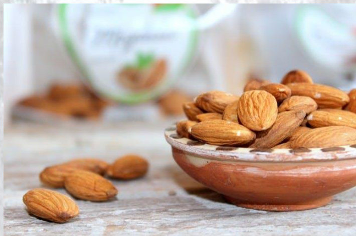
День мигдалю (США)