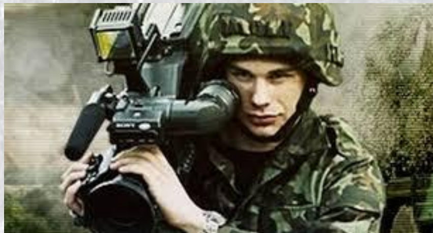
День військового журналіста України