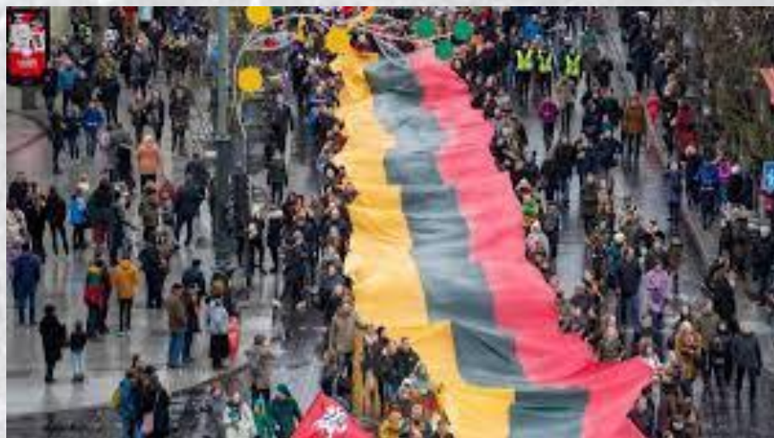
День відновлення Литовської держави