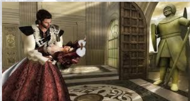
Прем'єра опери Олександра Даргомижського «Кам'яний гість» (1872)