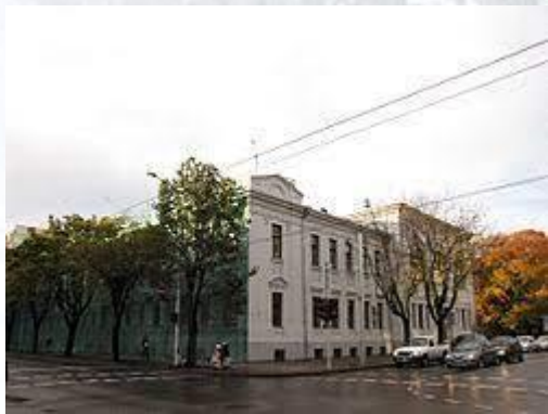
Відбулося офіційне відкриття Каунаського університету Вітольда Великого (Літва, 1922)