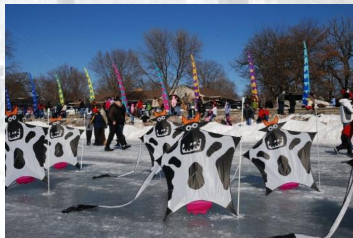
Повітряних зміїв «Розмалюй вітер» (США)