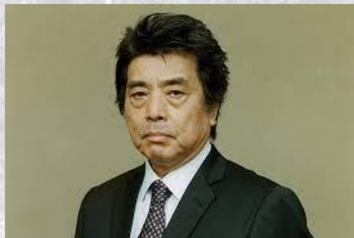
Письменник, сценарист і режисер Рю Муракамі (Японія, 1952)