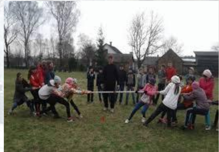
Міжнародний день перетягування канату