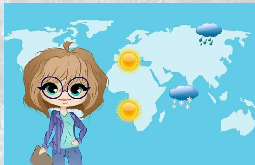
День народження синоптичної карти