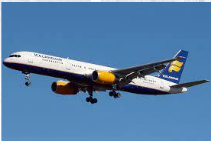
Перший політ пасажирського авіалайнеру «Боїнг-757» (1982)