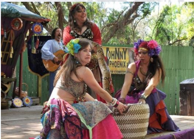
Ренесансу (Флорида, США)