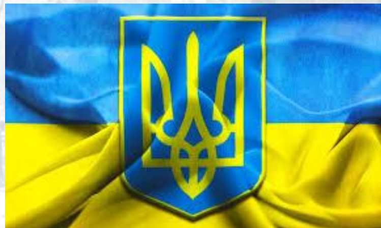
Верховна Рада України затвердила тризуб як малий герб України (1992)