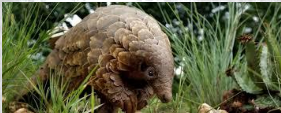
Всесвітній день панголіна