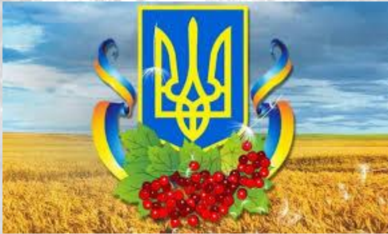
День державного герба України