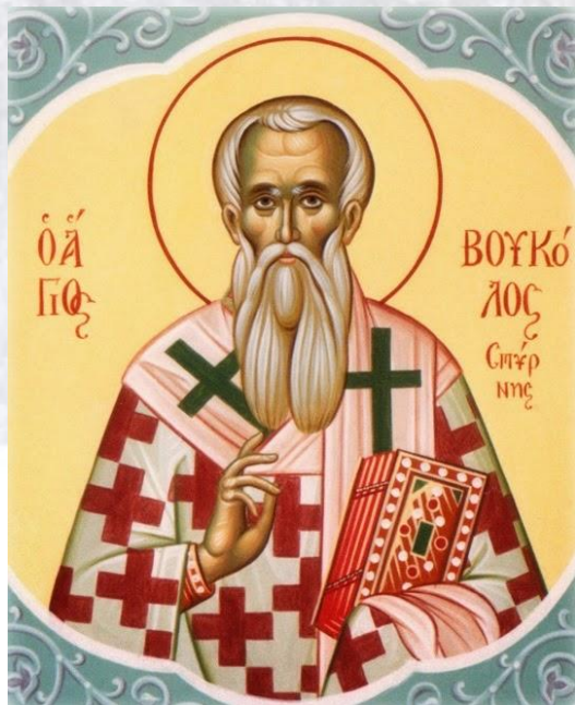
День пам'яті преподобного Вукола