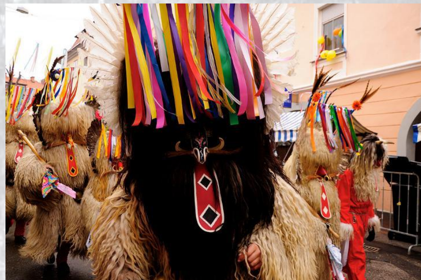
Карнавал Куренован'є (Словенія, 2022)