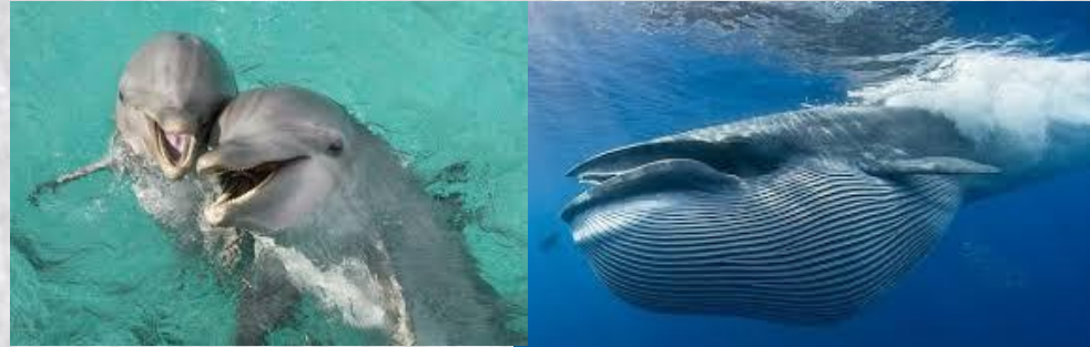
Всесвітній день китів і дельфінів