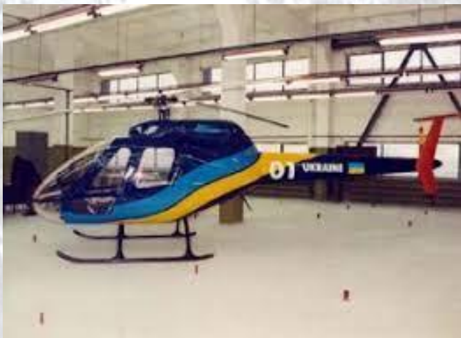
З конвеєра зійшов перший український гелікоптер «Ангел» (2002)