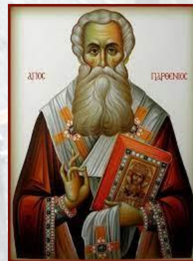
День пам'яті святителя Парфенія