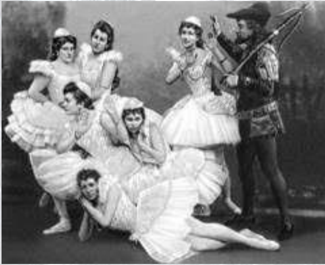
Прем'єра балету Петра Чайковського "Лебедине озеро» (1877)