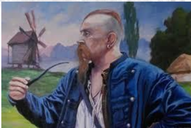
Міжнародний день курців люльки