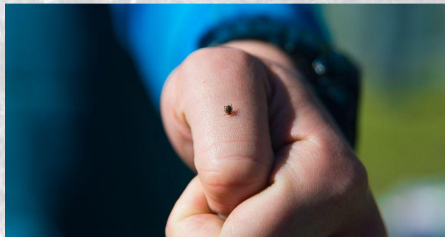
Всесвітній день енцефаліту