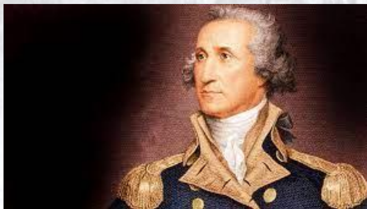
Батько-засновник США, учасник війни за незалежність, творець американського інституту президентства, перший президент Сполучених Штатів у 1789-1797 рр. Джордж Вашингтон (1732-1799)