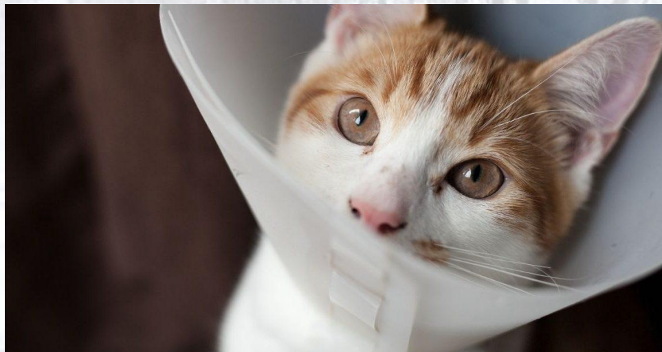
Всесвітній день стерилізації домашніх тварин