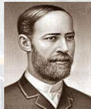
Фізик, засновник електродинаміки, на честь якого названа одиниця частоти Генріх Герц (Німеччина, 1857-1894)