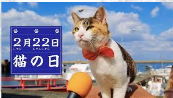
День кішки (Японія)