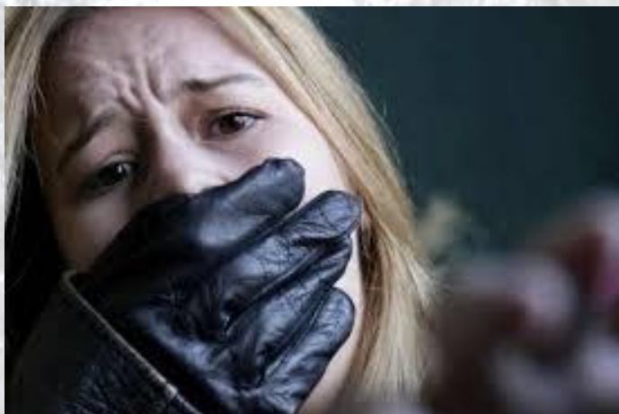
Міжнародний день підтримки жертв злочинів