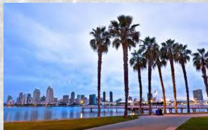
День штату Каліфорнія (США)