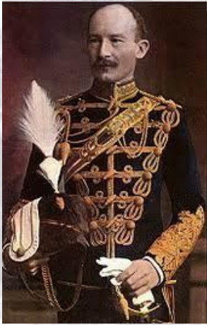
Засновник руху скаутів Роберт Баден- Пауелл (Англія, 1857-1941)