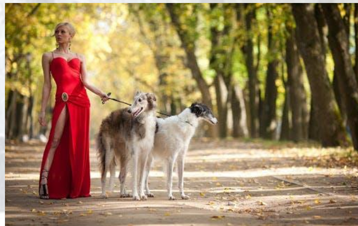
День прогулянки з собакою