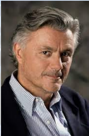
Письменник Джон Ірвінг (США, 1942)