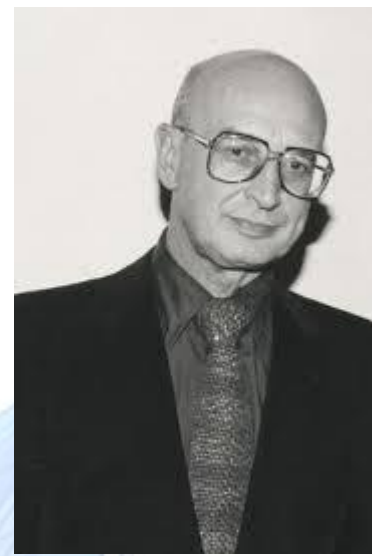
Композитор Вітольд Шальонек (Польща, 1927-2001)