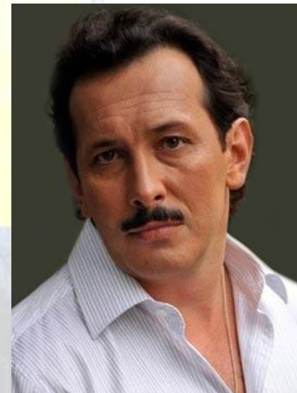
Актор театру і кіно, телеведучий, Народний артист України Олег Стальчук (1967)