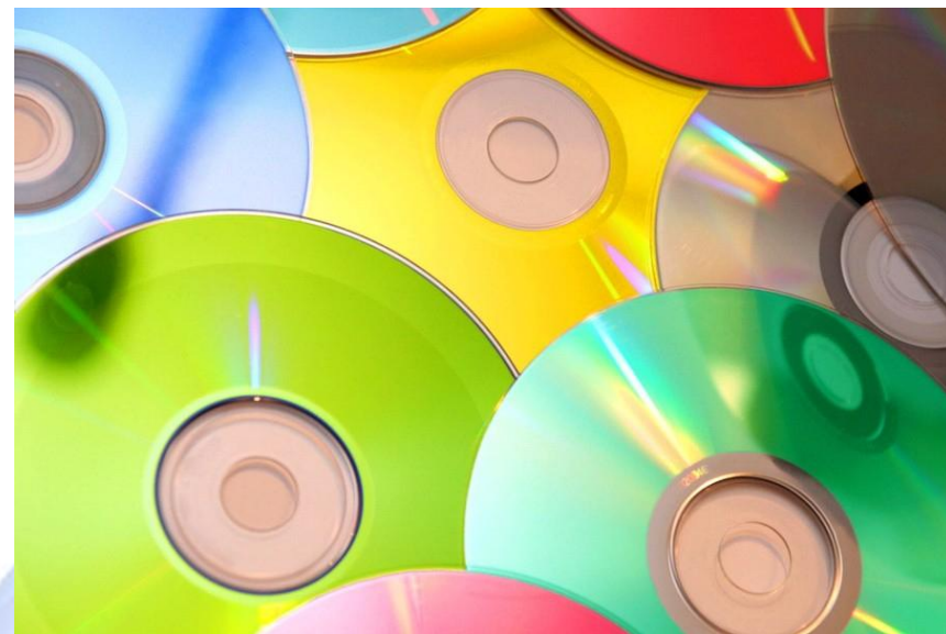
День народження компакт-диска