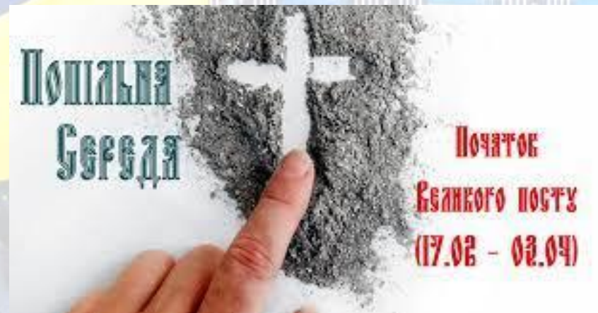
Свято західних християн