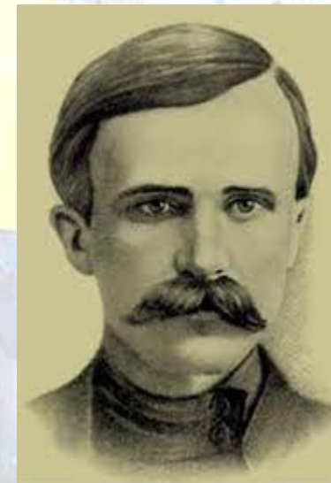
Письменник Архип Тесленко (1882-1911)