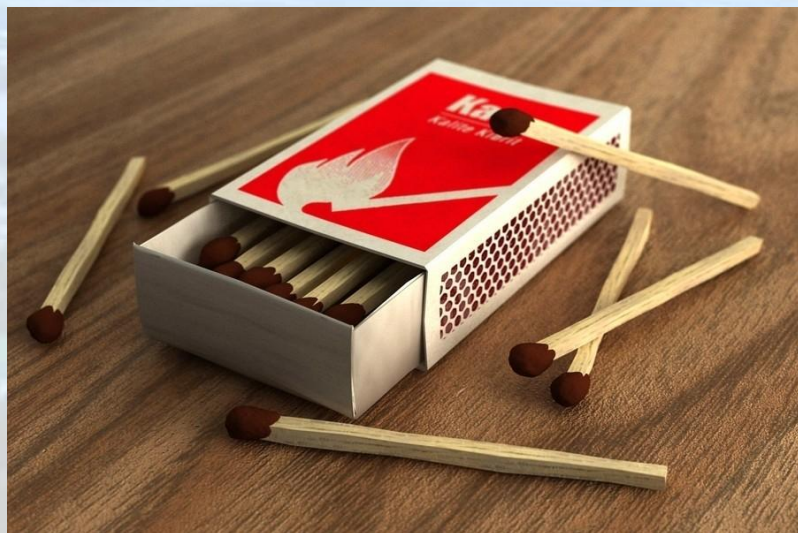
Міжнародний день сірника