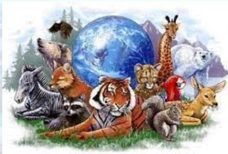
Всесвітній день дикої природи