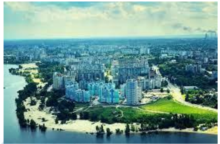
Затверджено генеральний план забудови Черкас, розроблений Київським інститутом проектування (1952)