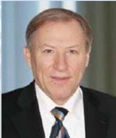
Гастроентеролог, професор Олег Бабак (1952)