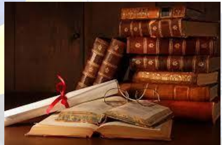
День книги (Великобританія, Ірландія)