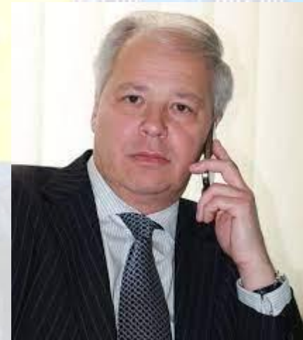
Офтальмолог, професор Сергій Могілевський (1962)