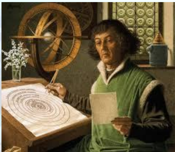
Миколай Коперник у Болоньї здійснив перші астрономічні спостереження (1497)