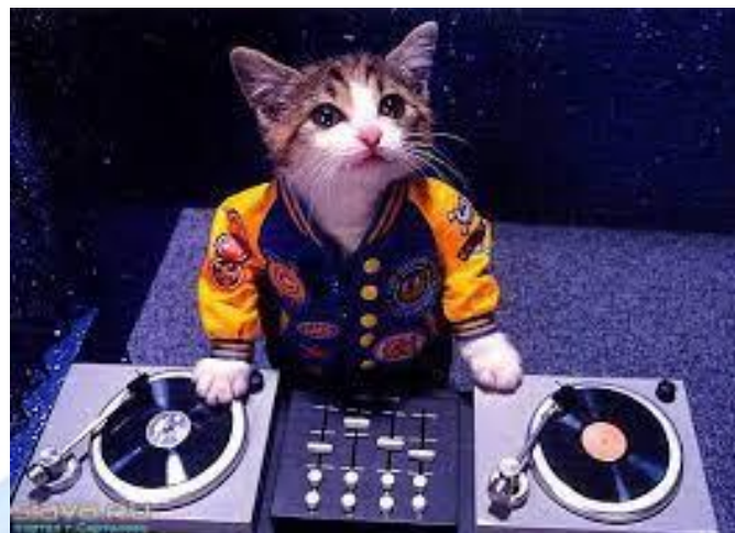
Міжнародний день ді-джея