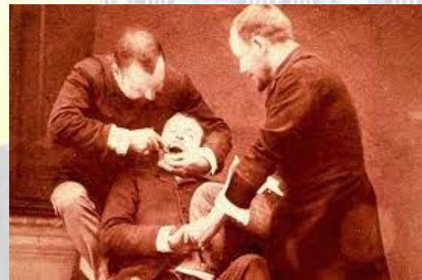
Чарльз Грехем отримав патент на штучні зуби (США, 1822)