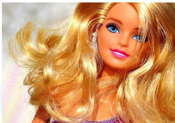
День народження ляльки Барбі