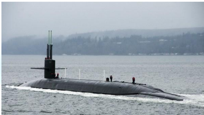
День підводного човна