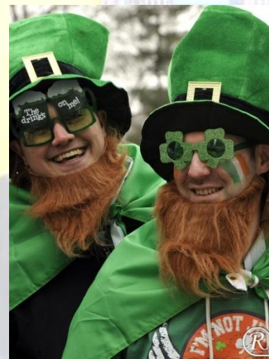
День святого Патріка (Ірландія)