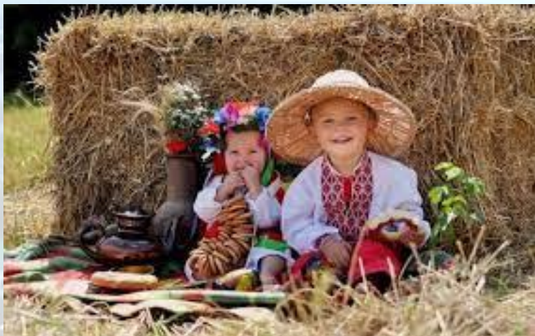
День абсолютно неймовірних дітей