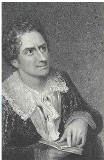
Актор-трагик, виконавець ролей у шекспірівських п'єсах Едмунд Кін (Англія, 1787-1833)