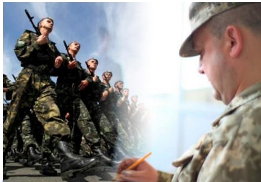
День мобілізаційного працівника (Україна)