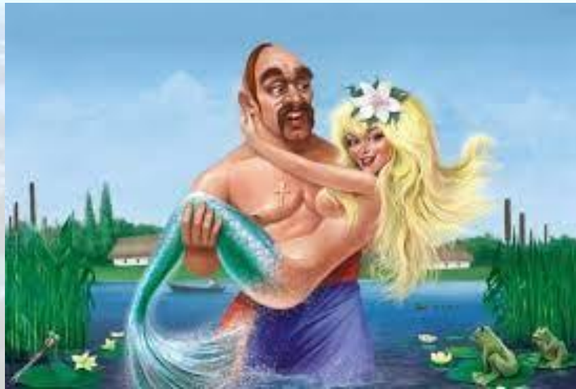
Міжнародний день русалки