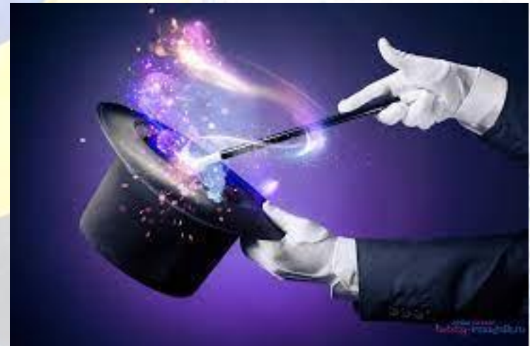
День фокусника (День диму і дзеркал) (США)