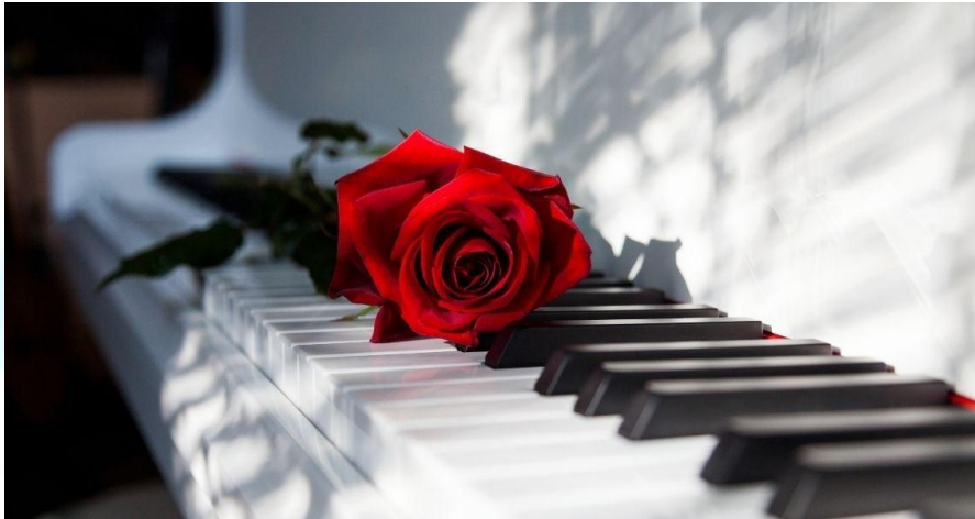
Всесвітній день фортепіано