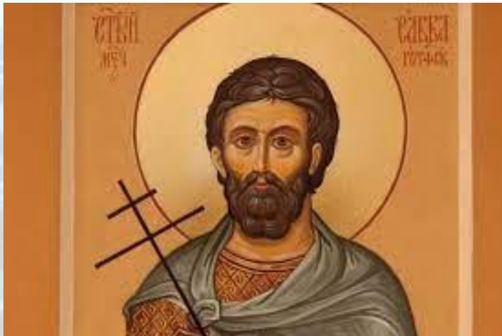
День пам'яті мученика Савіна Ермопольського