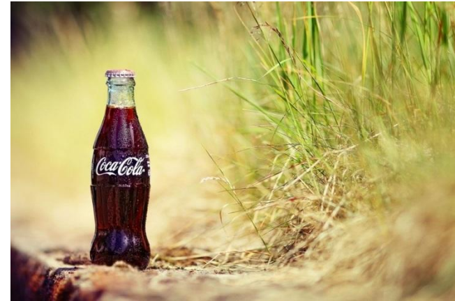
День народження Кока-коли