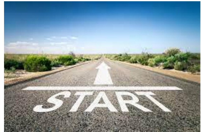
День великих змін