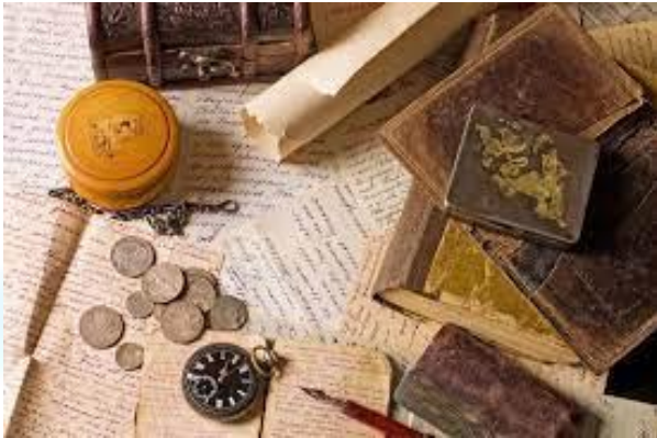
Всесвітній день історика