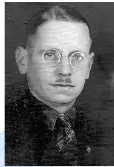
Діяч УНР, полковник, визначний діяч ОУН, публіцист і теоретик українського націоналізму Микола Сціборський (1897-1941)