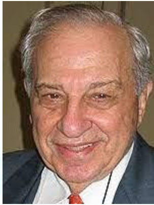
Фізіолог, Нобелівський лауреат 1938 року Корней Гейманс (Бельгія, 1892-1968)