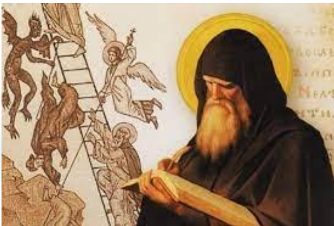
День пам'яті преподобного Іоанна Ліствичника