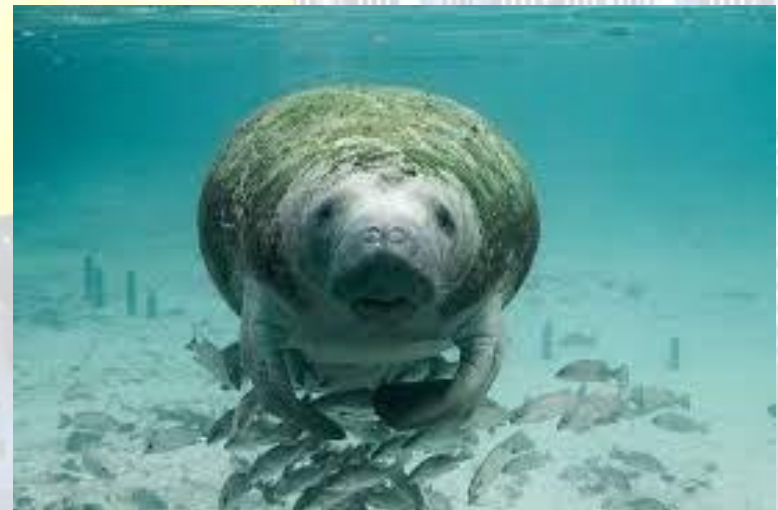
День подяки ламантину