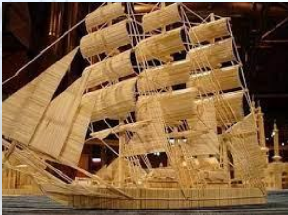
День сірникового кораблебудування