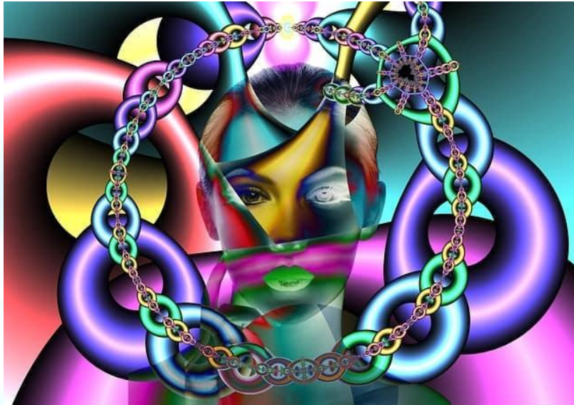
Всесвітній день біполярного розладу