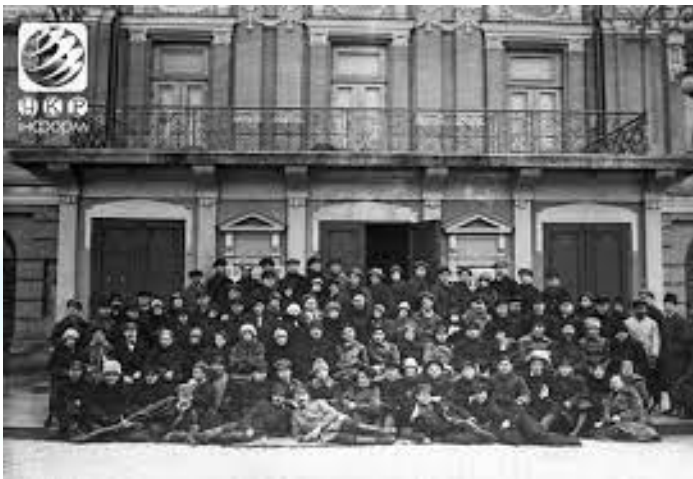
У Києві створений театр-студія «Березіль» (нині Харківський академічний український драматичний театр імені Тараса Шевченка) (1922)

Картину Вінсента ван Гога «Соняшники» продано за рекордну суму - 39,85 мільйонів доларів. У 1987 році її було продано вже за 40,3 мільйони, а в 1997 з'явилась інформація, що ця картина куплена японською страховою компанією – підробка (1982)