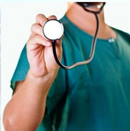
Національний день лікаря (США)