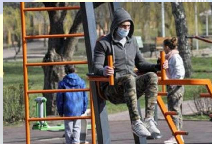
День прогулянки в парку (США)