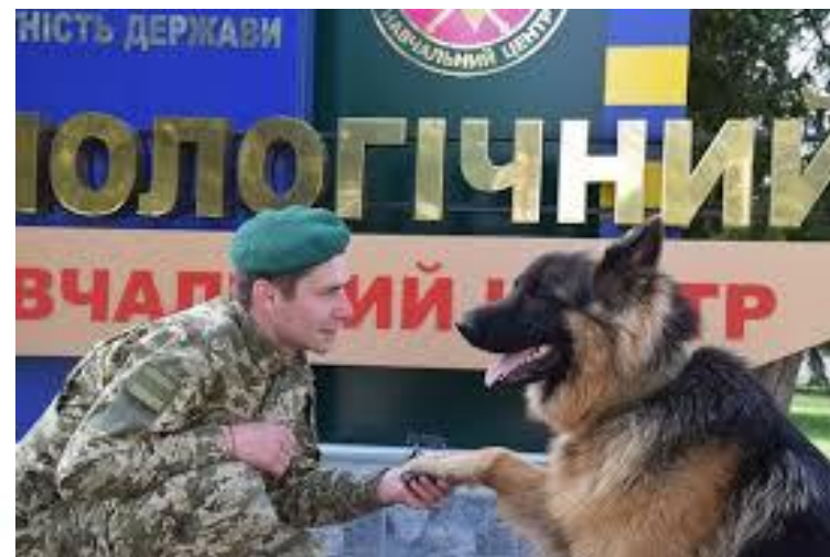
День кінолога в Україні