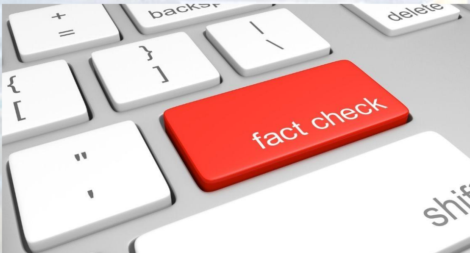
Міжнародний день перевірки фактів