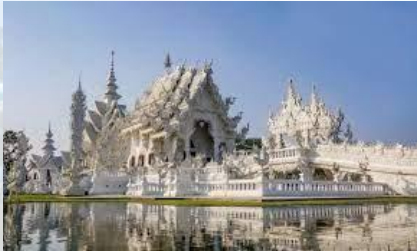
День охорони пам'яток старовини (Таїланд)