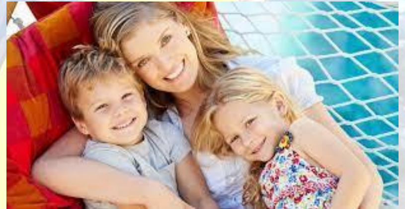
Національний день любові до наших дітей (США)