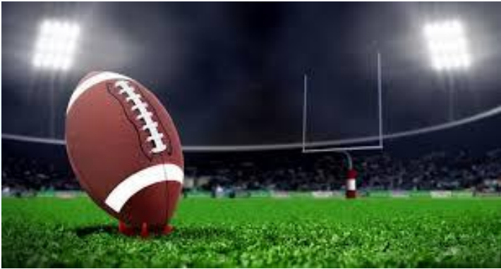
День народження регбі