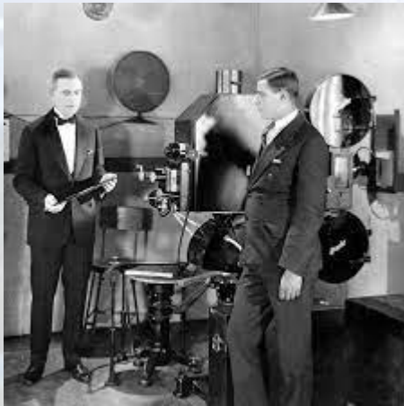
Здійснено першу публічну телепередачу на велику відстань: з Вашингтона до Нью- Йорка показали виступ міністра торгівлі Герберта Гувера (США, 1927)