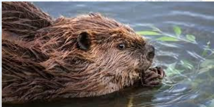
Міжнародний день бобра