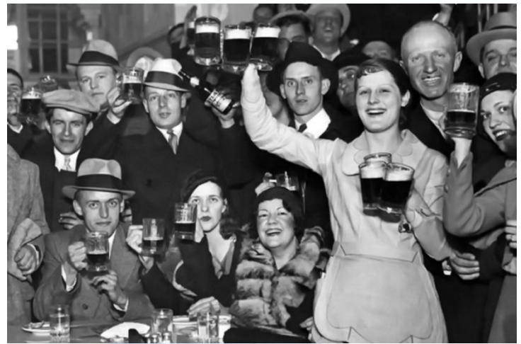
Національний день пива в США