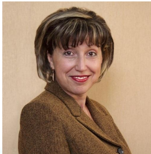
Терапевт, професор Наталія Золотарьова (1957)