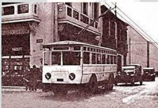
Здійснено останній рейс тролейбуса Нью-Йорка(1957)