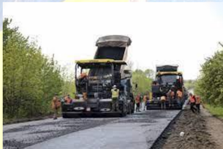
Міжнародний день обслуговування доріг