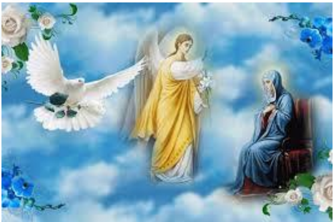
Благовіщення Пресвятої Богородиці