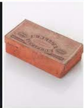
Англійський фармацевт Джон Вокер винайшов сірники (1827)