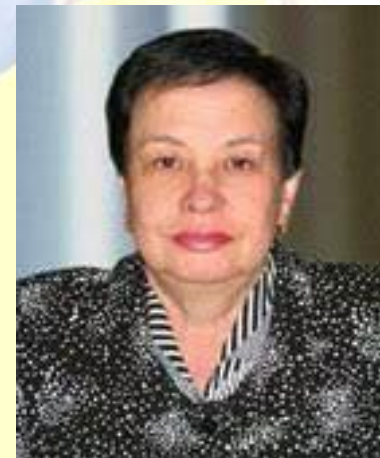
Гастроентеролог, професор Галина Анохіна (1947)