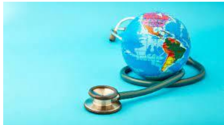
Всесвітній день здоров'я