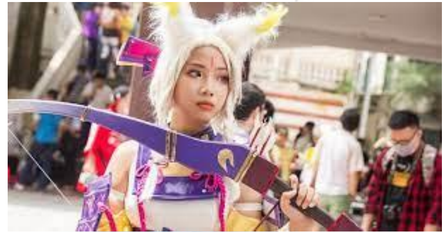
Міжнародний день анімешника