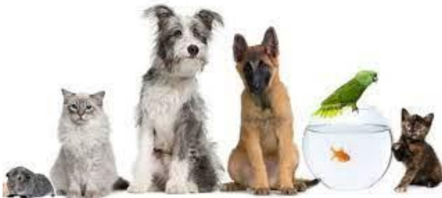
Національний день домашніх тварин (США)