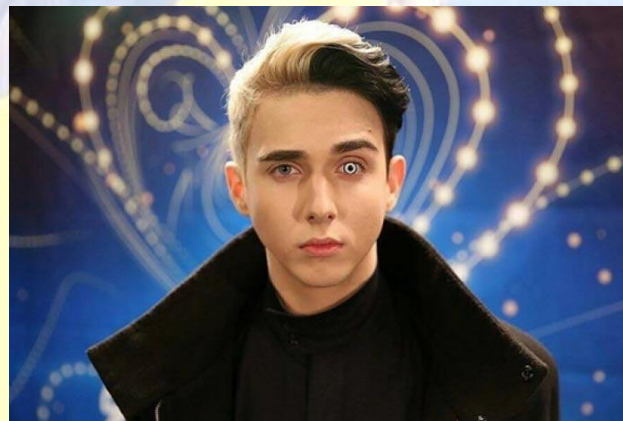
Естрадний співак Mélovin (Костянтин Боcharов) (1997)