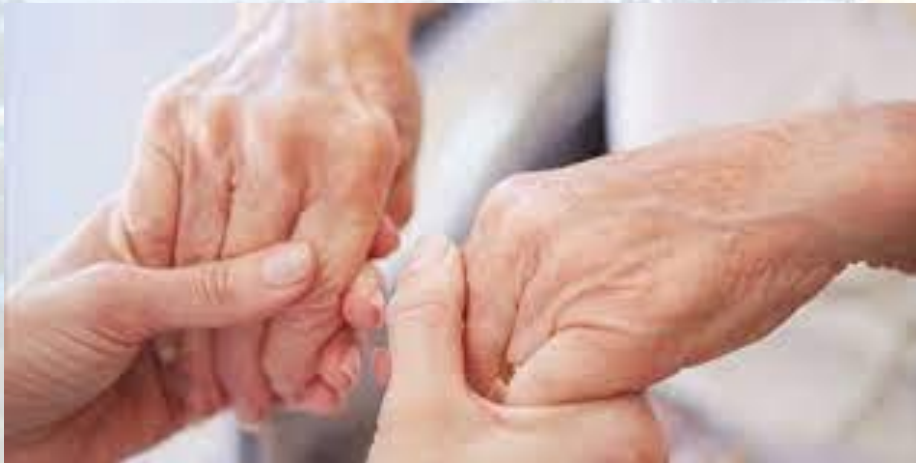
Всесвітній день боротьби з хворобою Паркінсона