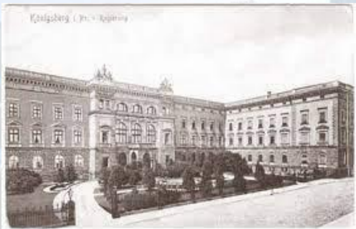
Відкрилося засідання першого пруського парламенту (ландтагу)(1847)