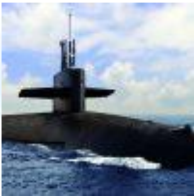
День підводного човна(США)