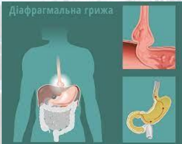
День вродженої діафрагмальної грижі