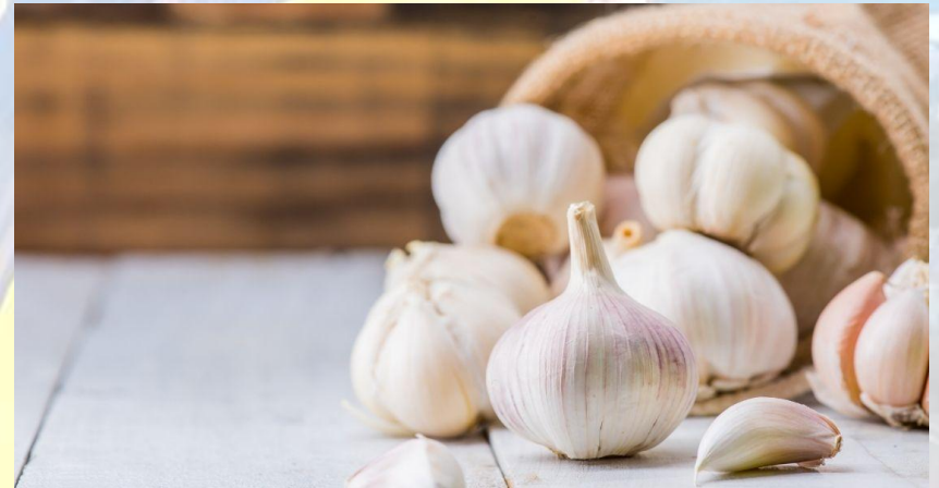
День часнику (США)