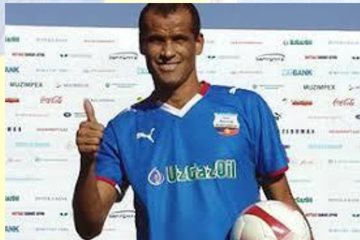
Футболіст, напівзахисник «Барселони», власник «Золотого м'яча» 1999 року Рівалдо (Бразилія, 1972)