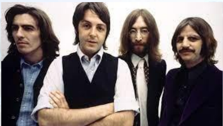
Члени групи «Бітлз» підписали контракт, яким вони зобов'язувалися не залишати групу протягом десяти років (1967)