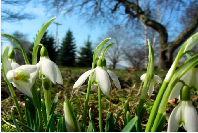
Міжнародний день проліска