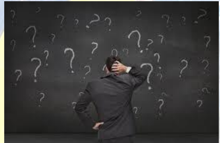
День пошуків сенсу життя