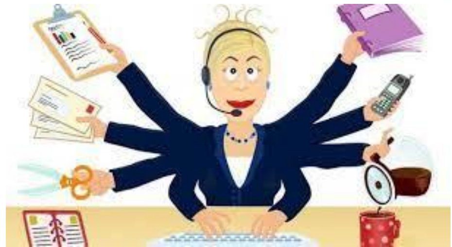
Міжнародний день секретаря