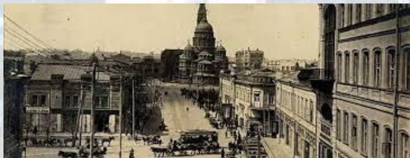
Харківське медичне товариство відкрило Пастерівський пункт щеплень та Бактеріологічну станцію (1887)