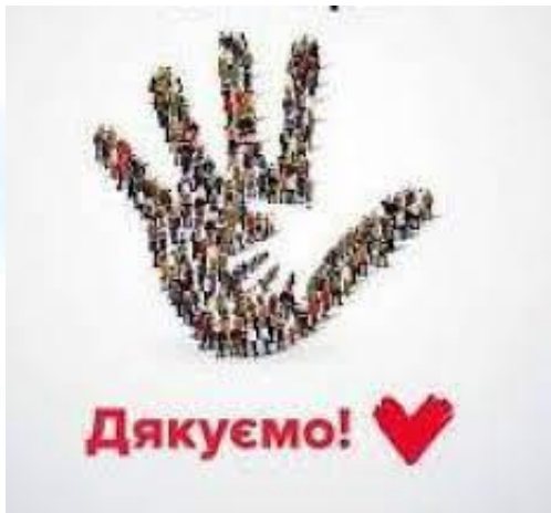
День вдячності волонтерам