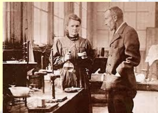
Подружжя французький фізиків Кюрі отримало чистий радій (1902)