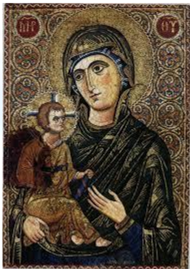
Свято ікони Божої Матері Візантійської