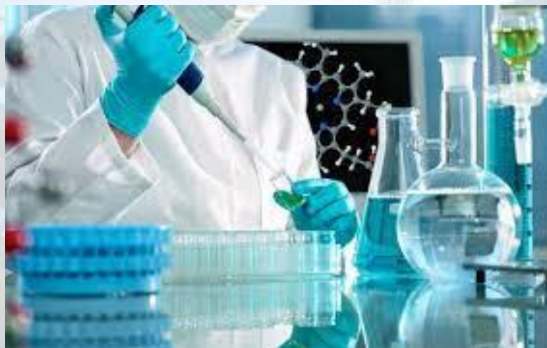
Всесвітній день лабораторій