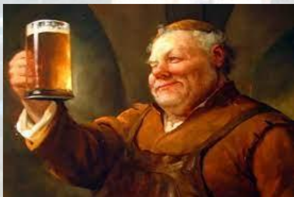
Національний день пива в Німеччині