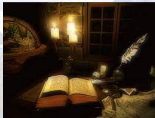
Всесвітня ніч книги (Великобританія)