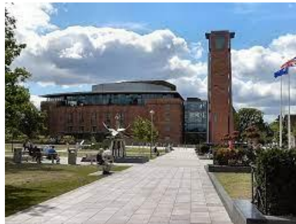
На батьківщині Вільяма Шекспіра місті Стретфорд-на-Ейвоні відкрився Королівський Шекспірівський театр, котрий регулярно проводить шекспірівські фестивалі (1932)