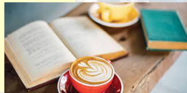
День книги (Канада)