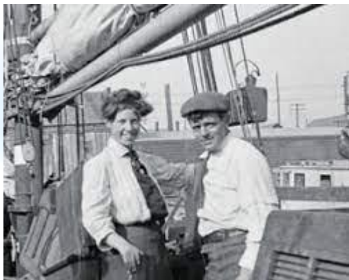
Джек Лондон відправився в навколосвітню подорож на двощогловому судні (1907)