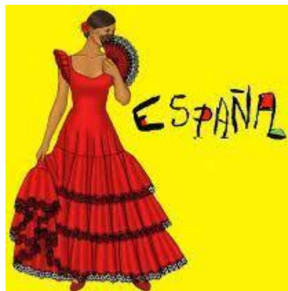
День іспанської мови в ООН