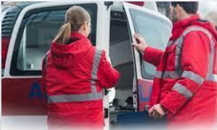
День працівників швидкої медичної допомоги!