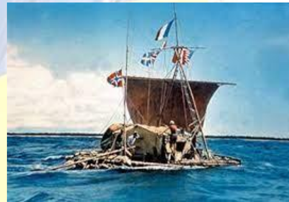
Норвезький дослідник Тур Хейєрдал із п'ятьма товаришами на бальзовому плоті відплив від західного узбережжя Південної Америки (Перу) до Таїті. Пліт отримав ім'я бога інка Кон-Тікі (1947)