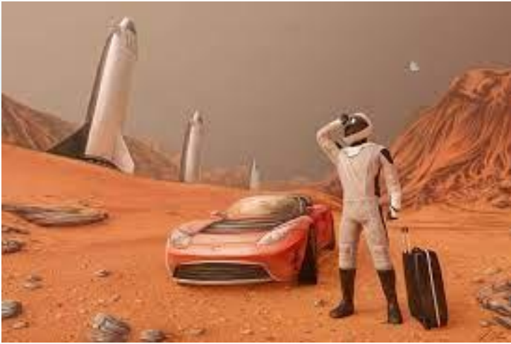
День космічного туризму