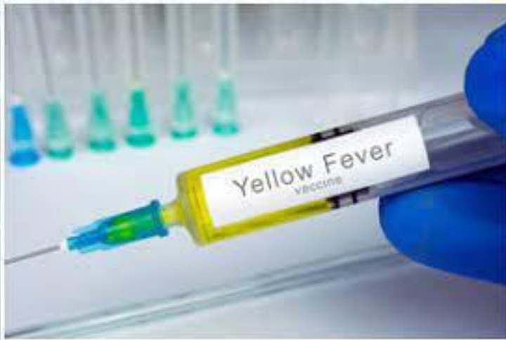
Відкриття вакцини проти жовтої гарячки (1932)