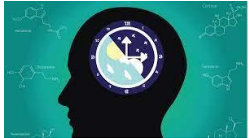
День біологічного годинника