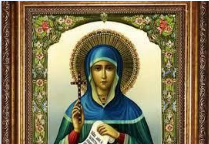
День пам'яті святої мучениці Анастасії Римської