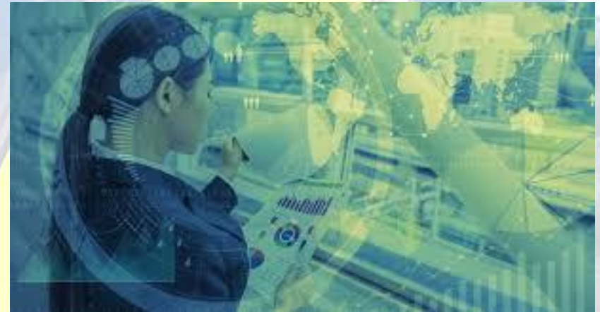
Міжнародний день дівчат в ІТ