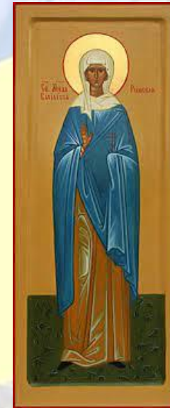
День пам'яті святої мучениці Басиліси Римської