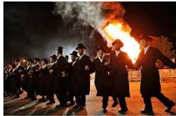
Свято «Лав ба-Омер» (Ізраїль)