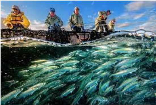
Останній день рибальського сезону (Ісландія)