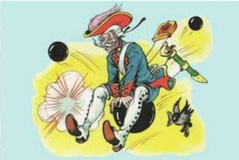
День народження барона Мюнхаузена