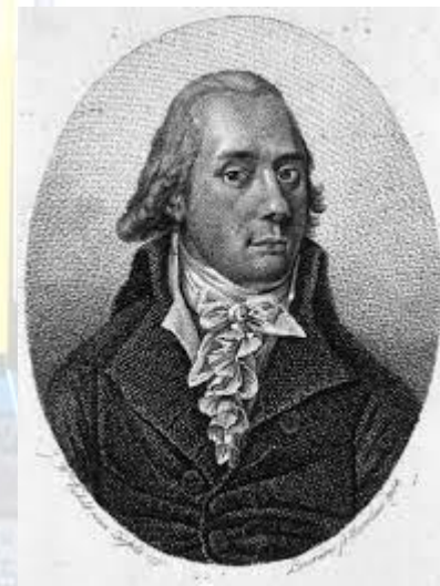
Фізіолог, анатом, засновник фізичної антропології Йоганн Блюменбах (Німеччина, 1752-1840)