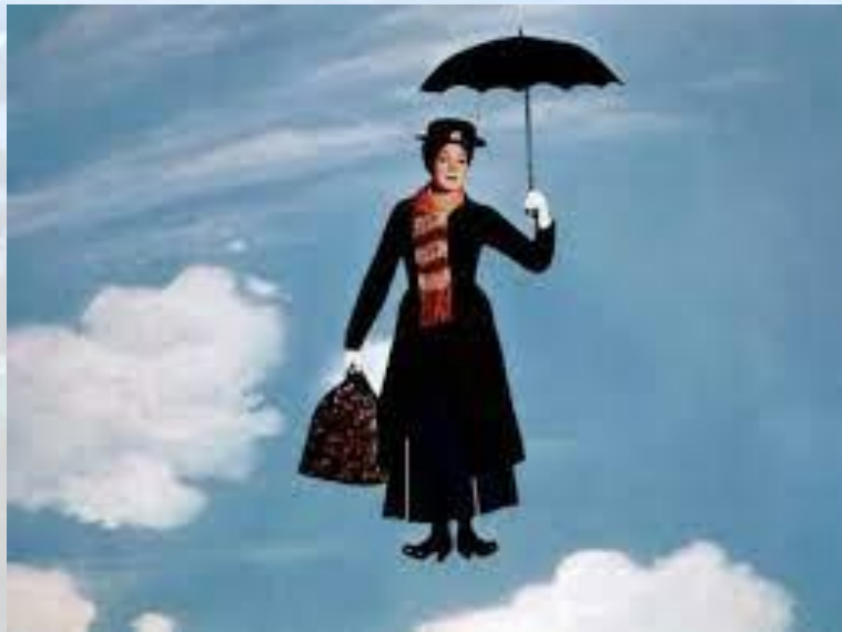
День очікування Мері Поппінс