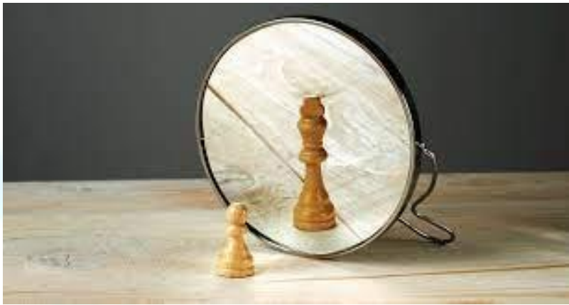
Всесвітній день обізнаності про егоїзм