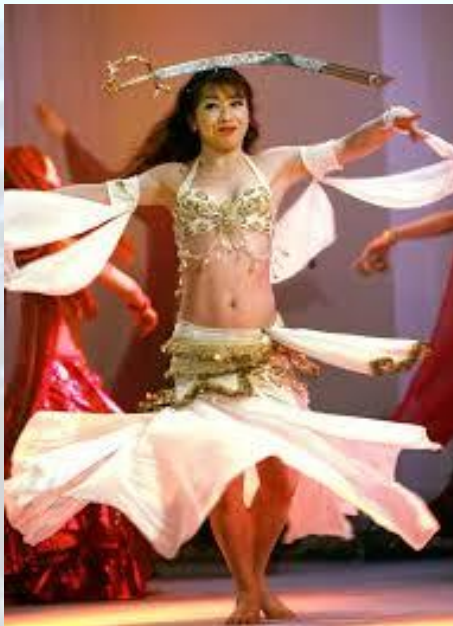
Всесвітній день танцю живота