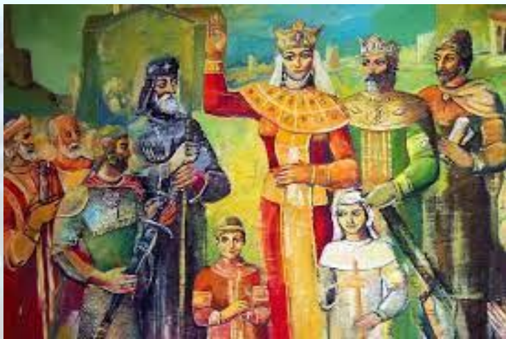
День пам'яті благовірної святої Тамари, цариці грузинської (Тамароба)