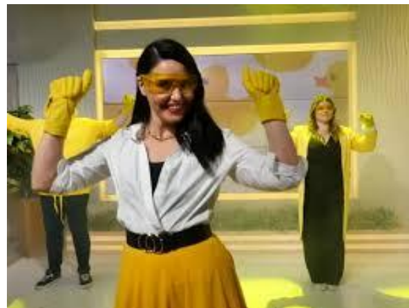
День танцю маленьких каченят