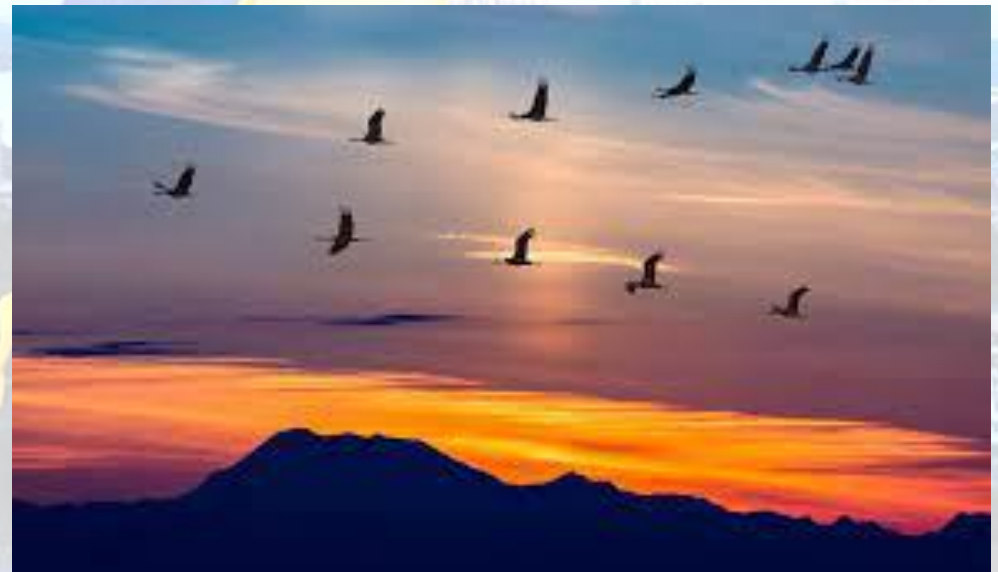
Всесвітній день мігруючих птахів