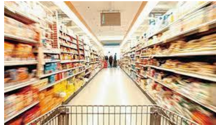
Всесвітній день справедливої торгівлі