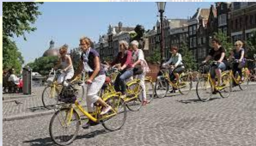
День велосипедиста (Нідерланди)