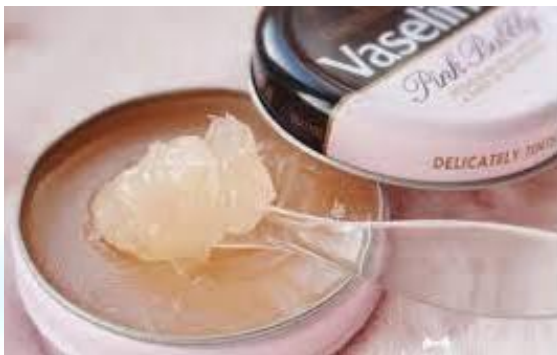
День народження вазеліну