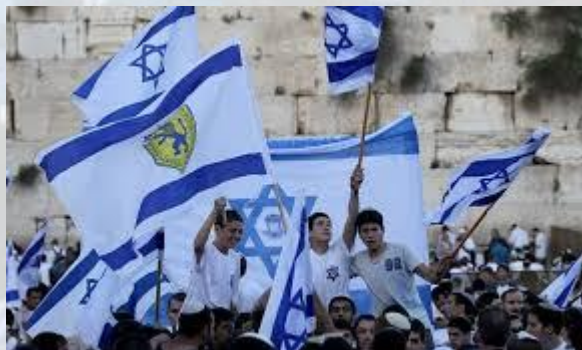
День Єрусалима (Ізраїль)