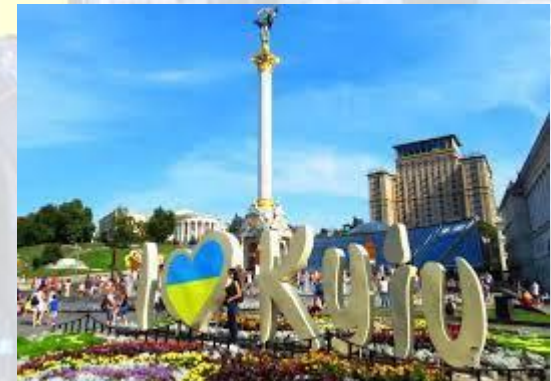
День міста Київ