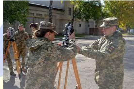
День топографічної служби ЗСУ