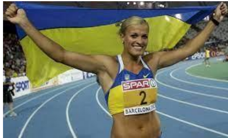
Легкоатлетка, олімпійська чемпіонка Наталія Добринська (1982)