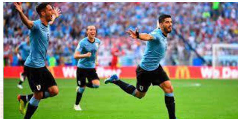
День південноамериканського футболу