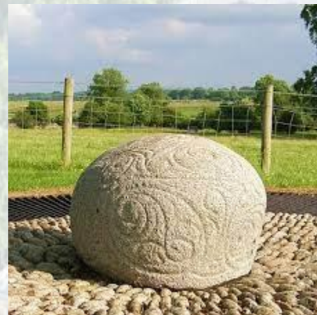
Міжнародний день кельтського мистецтва