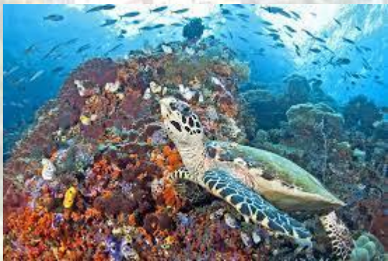
День коралового трикутника