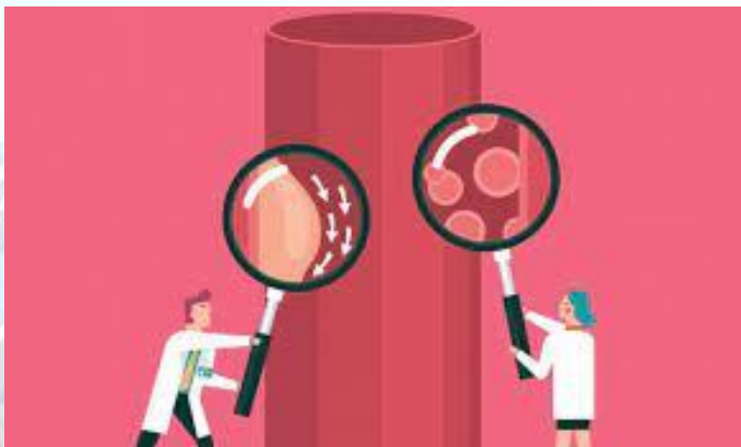
Всесвітній день антифосфоліпідного синдрому