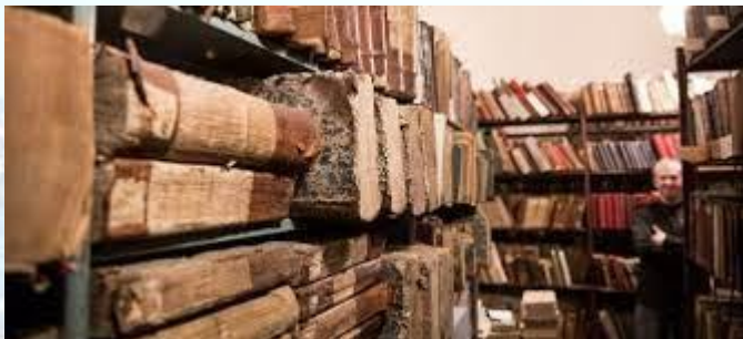
Міжнародний день архівів