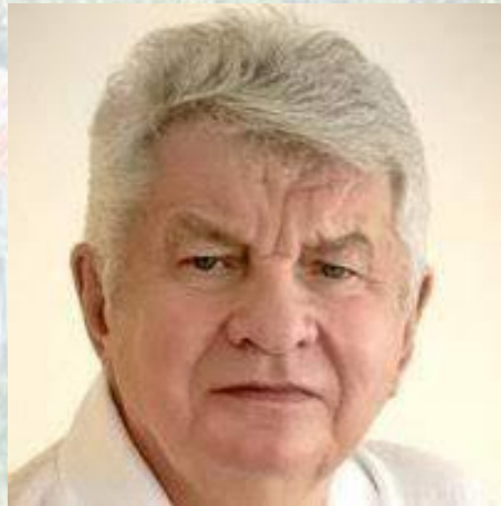
Лікар, професор Володимир Козявкін (1947)