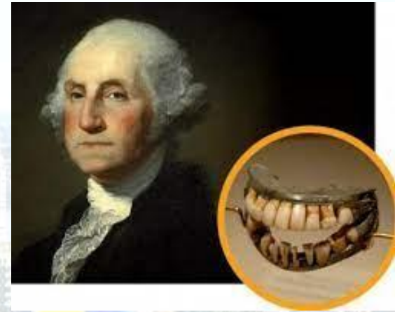
Чарльз Грем запатентував штучну щелепу (США, 1822)