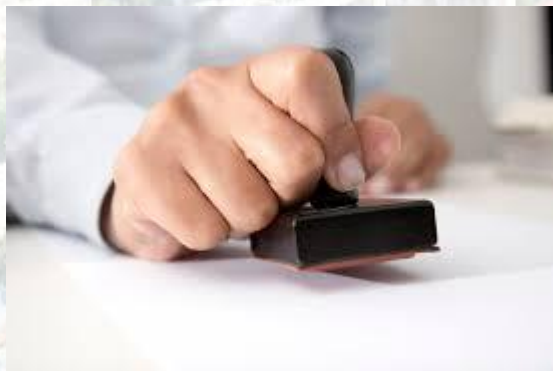
Всесвітній день акредитації