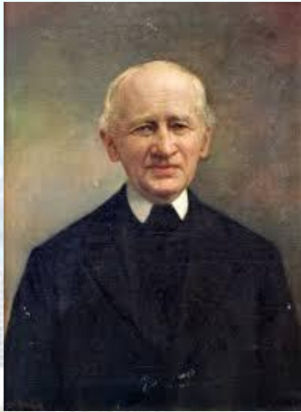
Астроном, який відкрив планету Нептун Йоган Галле (Німеччина, 1812-1910)