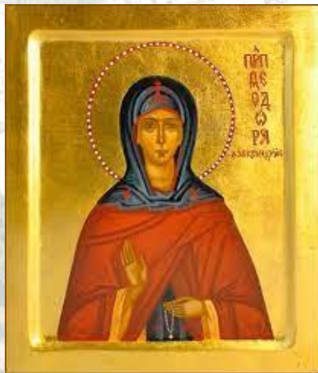
День пам'яті мучениці Феодори Олександрійської