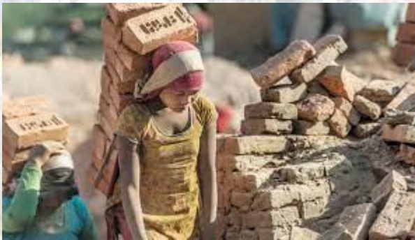
Всесвітній день боротьби з дитячою працею