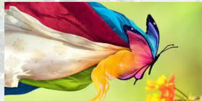
День працівників текстильної і легкої промисловості