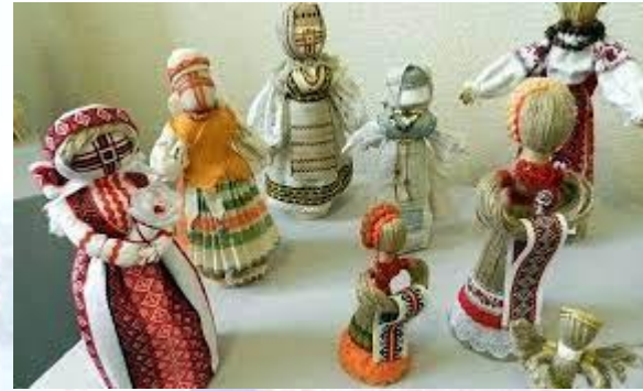
Всесвітній день ляльок