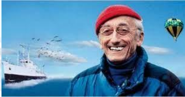
День Жака-Іва Кусто