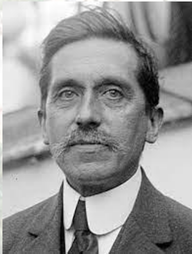
Фізик. Відкрив у стратосфері шар озону Шарль Фабрів (Франція, 1867-1945)