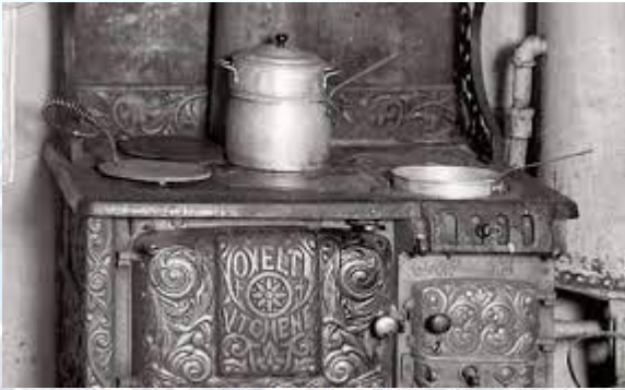
Бенджамін Франклін винайшов кухонну плиту (США, 1742)