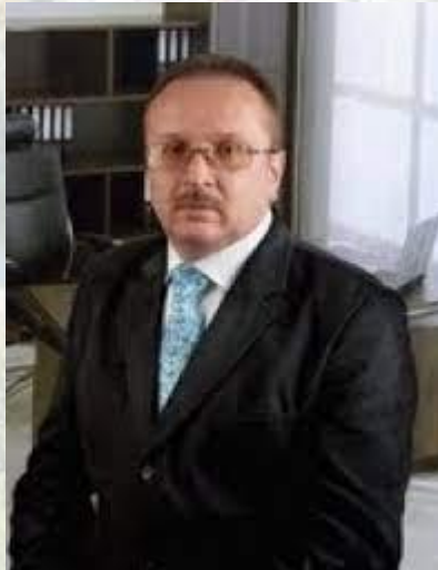
Хірург, професор Олександр Іващук (1967)