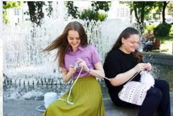
Всесвітній день в'язання на публіці