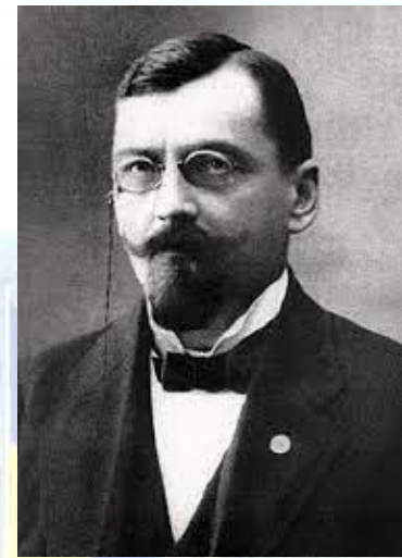
Інженер-хімік, поет, «батько поезії на есперанто» Антоній Грабовський (Польща, 1857-1921)