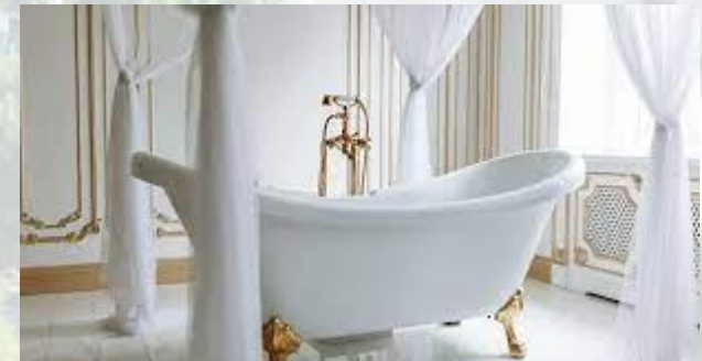
Міжнародний день ванни (лазні)