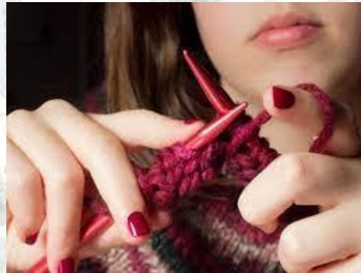
Всесвітній день в'язання