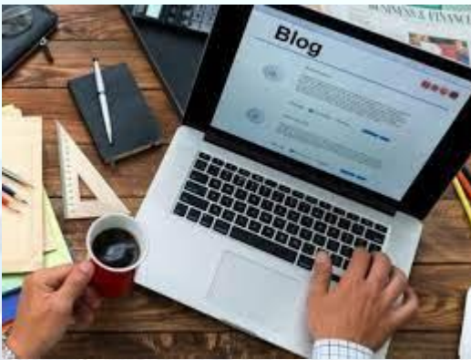
Міжнародний день блогера