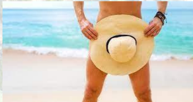
Міжнародний день натуристів (День нудиста)