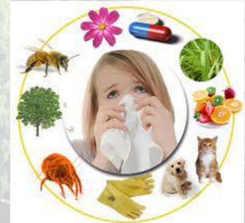
Всесвітній день боротьби з алергією