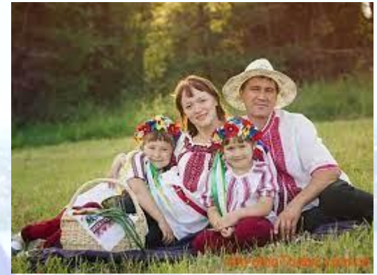
День родини в Україні