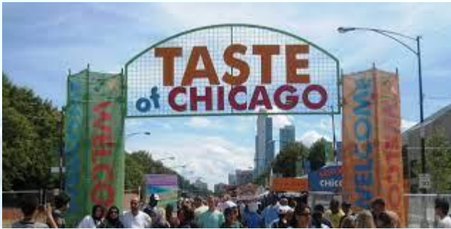
Фестиваль «Смак Чикаго» (США)