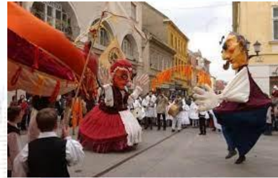
Фестиваль вина «Бича кров» (Угорщина)