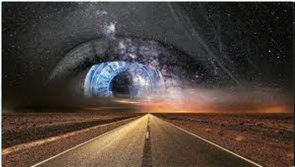
День спілкування із Всесвітом