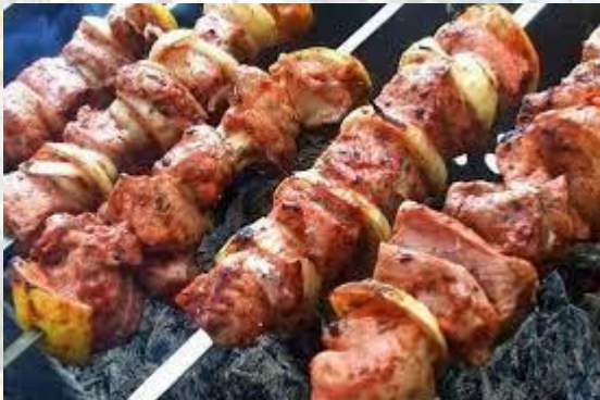
Всесвітній день шашлику