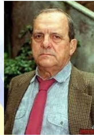
Режисер, сценарист, письменник Даміано Даміані (Італія, 1922-2013)