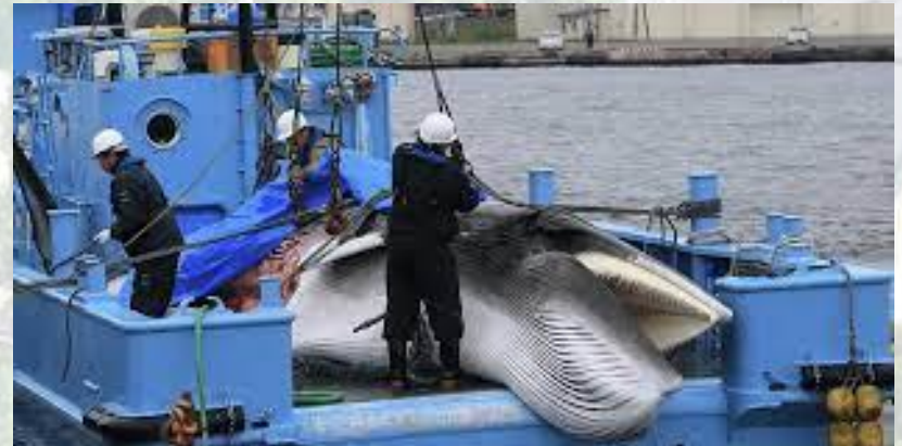
Введено повний мораторій на промисел китів у комерційних цілях (1982)