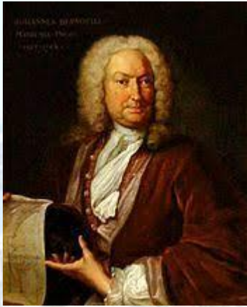
Математик Йоганн Бернуллі (Швейцарія, 1667-1748)