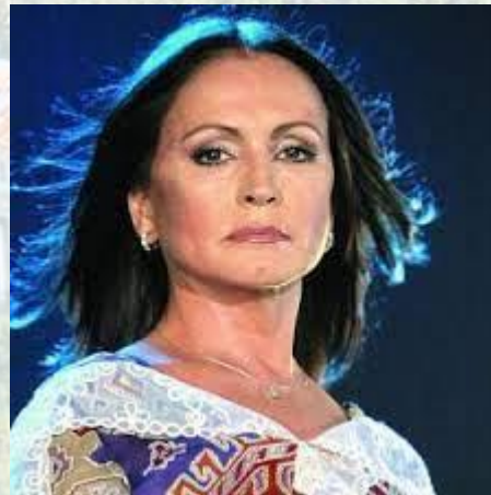
Співачка Софія Ротару (1947)