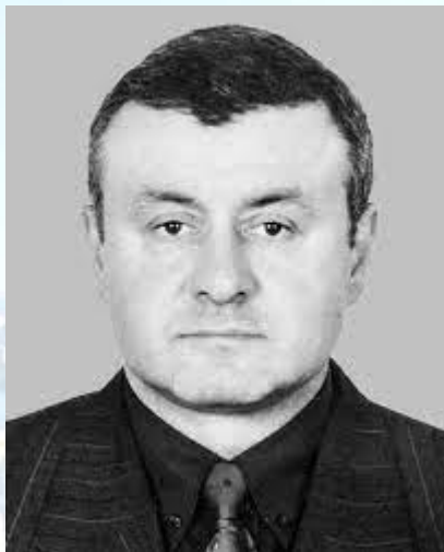
Хірург, професор Олександр Лагода (1957)