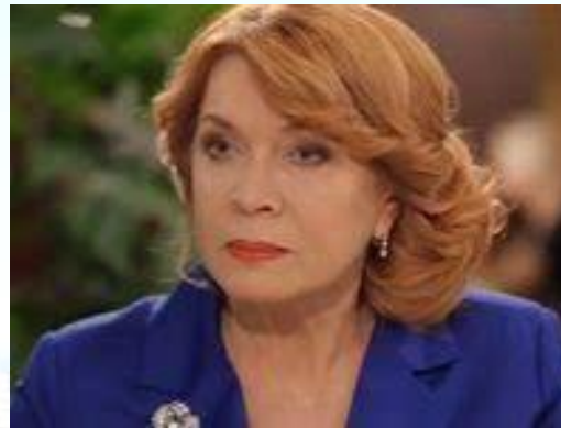
Акторка театру та кіно Людмила Смородина (1957)