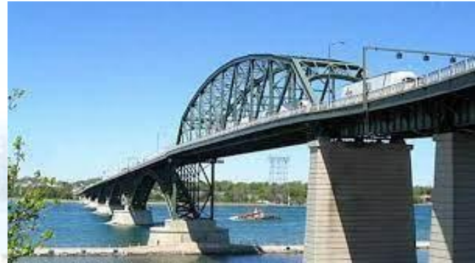
Відкрито міст Миру між Форт-Ері (Канада) та Буффало (США) (1927)