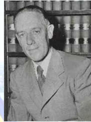
Фізіолог, батько біофізики Детлев Вулф Бронк (США, 1897-1975)