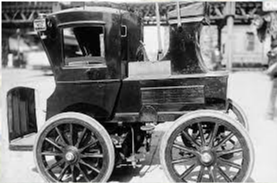
У Нью-Йорку з'явилися перші таксі (1907)