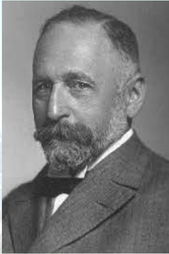
Хімік, Нобелівський лауреат 1942 року Ріхард Мартін Вільштеттер (Німеччина, 1872-1942)