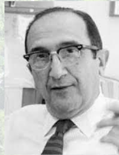
Мікробіолог, вірусолог, Нобелівський лауреат 1969 року Сальвадор Лурія (США, 1912-1991)