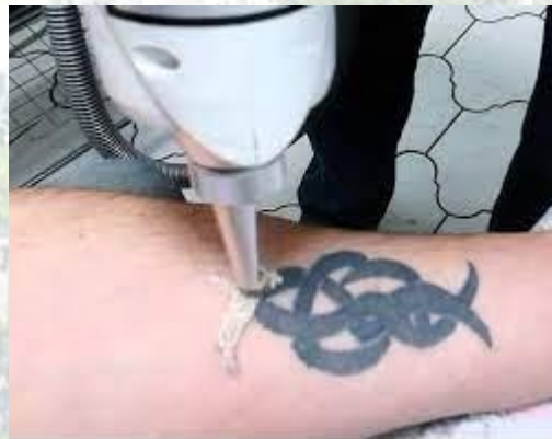
День зведення татуювання