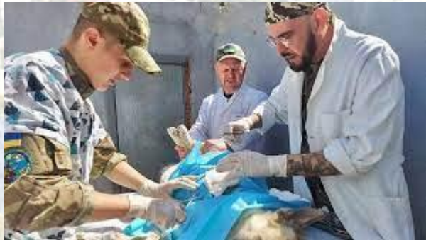
День працівників ветеринарної медицини