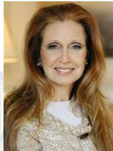
Письменниця, знаменита романістка і новеллістка Даніела Стіл (було продано більше 550 мільйонів її книг) (США, 1947)