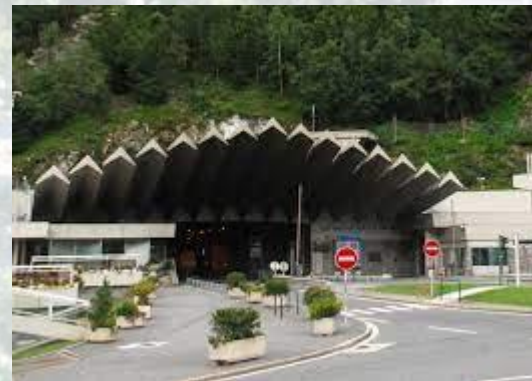
У Франції завершене будівництво тунелю під Монбланом (1962)