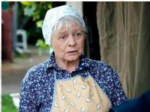
Актриса театру та кіно Валерія Чайовська (1947)