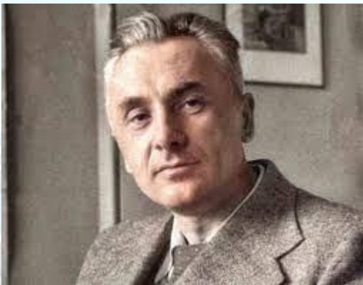
Письменник Юрій Яновський (1902-1954)