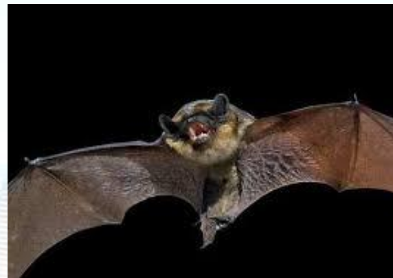
Міжнародна Ніч кажанів