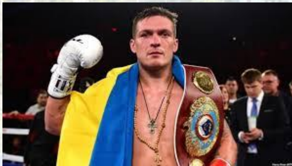
Міжнародний день боксу