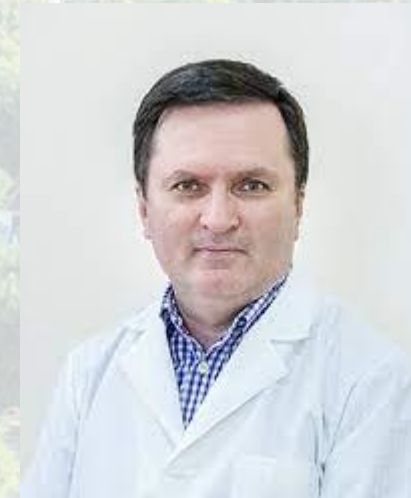
Гастроентеролог, професор Вадим Шипулін (1967)