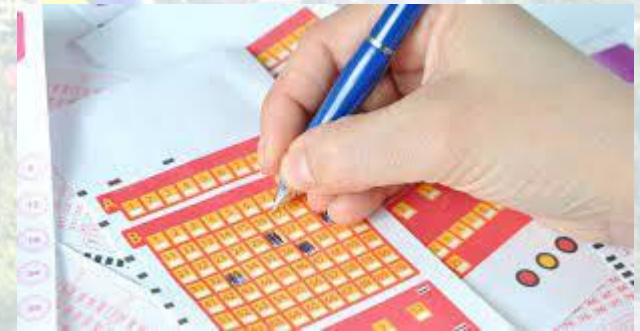
Міжнародний день лотереї