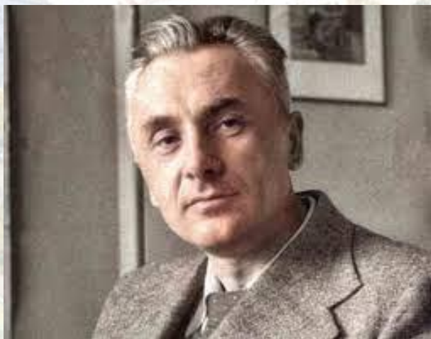
Письменник, журналіст Юрій Яновський (1902-1954)