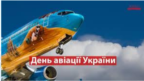
День авіації України