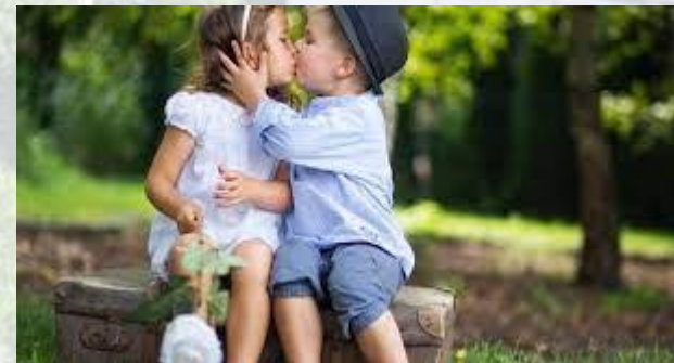
День першого поцілунку