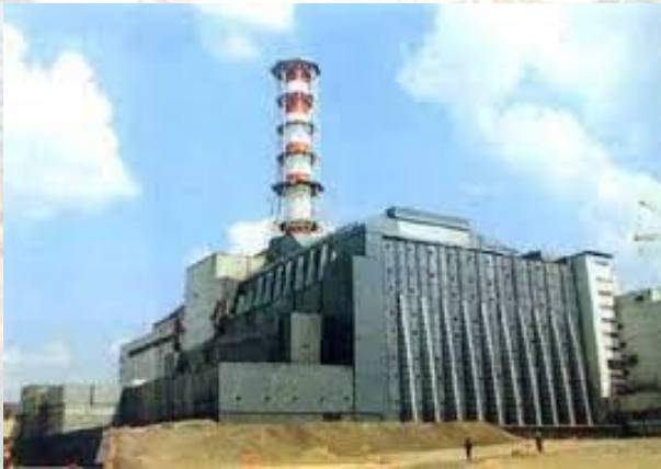
На Чорнобильській АЕС запустили в дію 1-й енергоблок (1977)