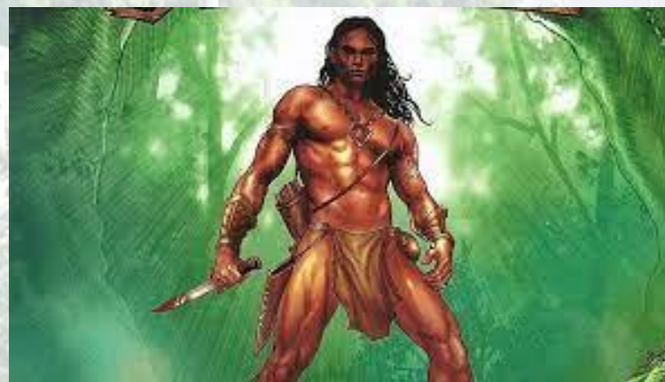
Едгар Берроуз опублікував перше оповідання про пригоди Тарзана (США, 1912)