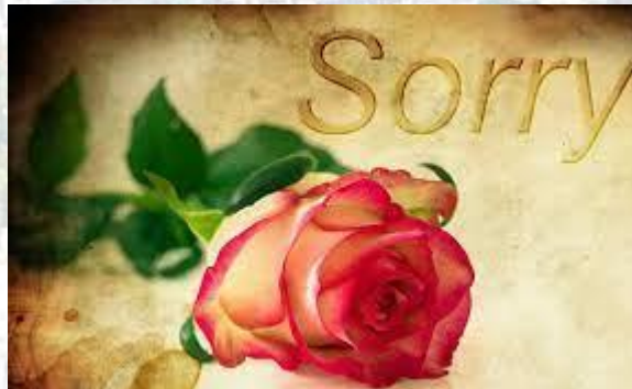
Всесвітній день прощення