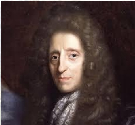
Філософ-просвітитель, автор емпіричної теорії пізнання Джон Лок (Англія, 1632-1704)