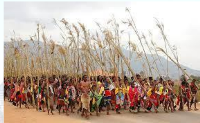
Свято «Умхланга», «Танець очерету» (Свазіленд)