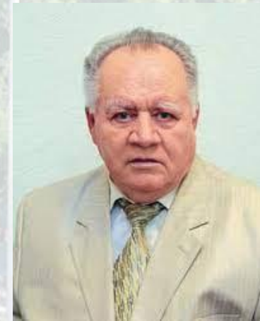
Фізіолог, професор Віталій Єщенко (1937—2013)