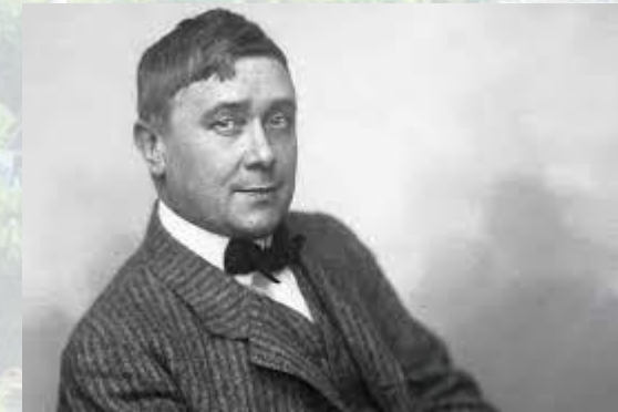
Письменник, Нобелівський лауреат 1911 року ("Синій птах") Моріс Метерлінк (Бельгія, 1862-1949)