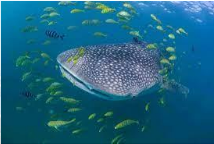
Міжнародний день китової акули