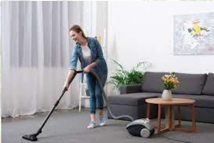
День народження електричного пилососа