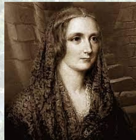
Письменниця Мері Шеллі (Англія, 1797-1851)