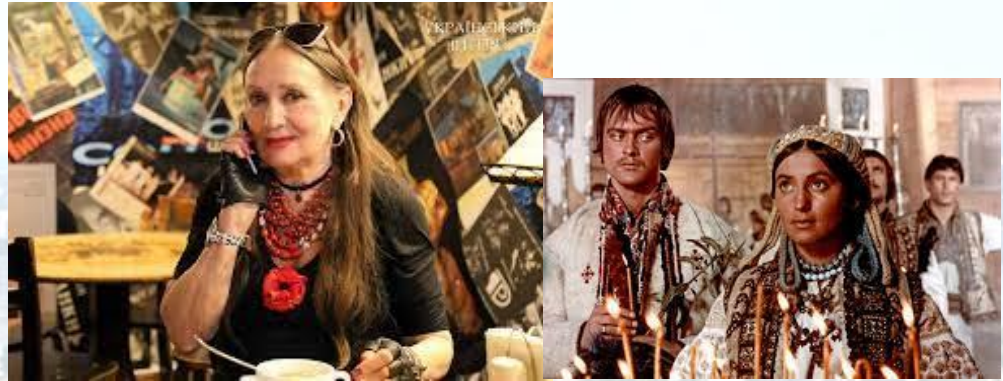
Акторка театру і кіно («Тіні забутих предків») Лариса Кадочникова (1937)