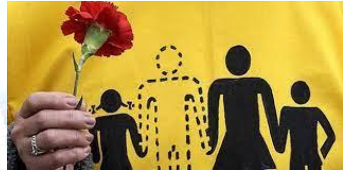
Міжнародний день жертв насильницького зникнення