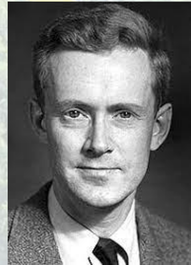
Фізик, який відкрив ядерний магнітний резонанс, Нобелівський лауреат 1952 року Едвард Мілс Персел (США, 1912-1997)