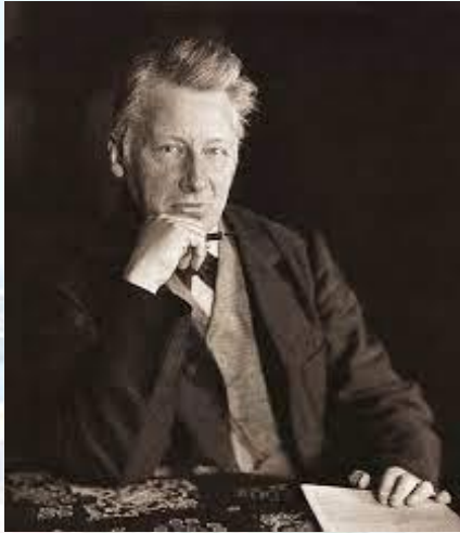
Фізико-хімік, Нобелівський лауреат 1901 року Якоб Вант-Гофф (Нідерланди, 1852-1911)