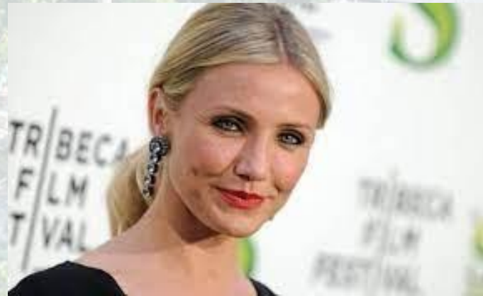
Акторка і модель Кемерон Діас (США, 1972)