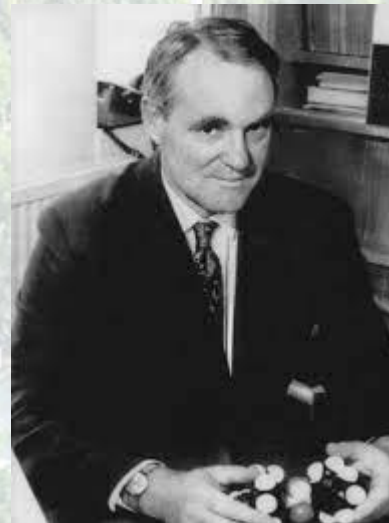
Хімік-органік, Нобелівський лауреат 1975 року Джон Воркап Корнфор (Австралія, 1917-2013)

В Новому Орлеані, Луїзіана, відбувся перший в США професійний боксерський поєдинок за сучасними правилами - в боксерських рукавичках і з трьохвилинними раундами. У 21-му раунді американець Джеймс Корбетт нокаутував живу легенду США, останнього чемпіона в боксі без рукавичок, Джона Саллівана. (США, 1892)