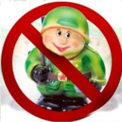
День відмови від військової іграшки, або День її знищення