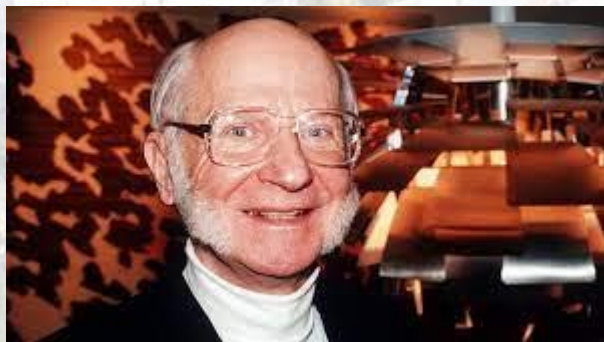
Фізик, Нобелівський лауреат 1989 року Ганс Демельт (США, 1922-2017)