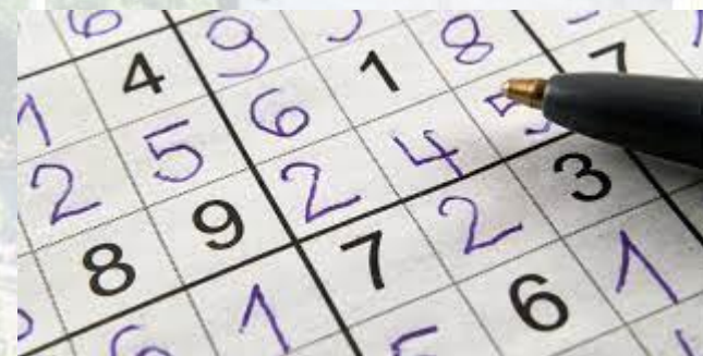
Міжнародний день sudoku