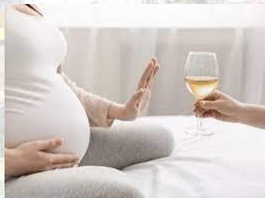
Міжнародний день алкогольного синдрому плоду