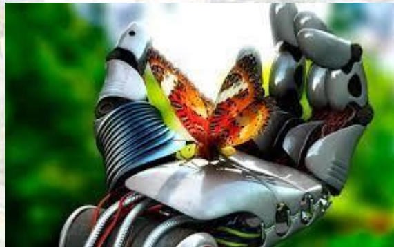
День народження біоніки