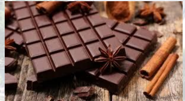
Міжнародний день шоколаду