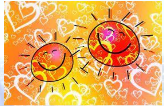
День позитивного мислення