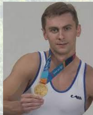
Гімнаст, олімпійський чемпіон (2004) і срібний призер (2000) Олімпійських ігор Валерій Гончаров (1977)