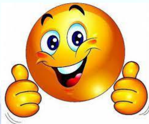
День народження смайлика