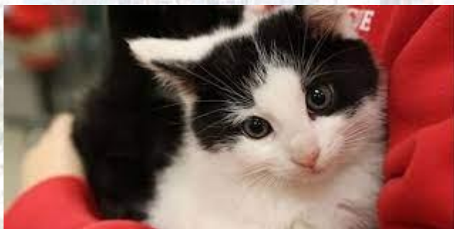
Тиждень приручення тварин