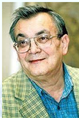
Композитор, голова Національної спілки композиторів України (з 2005 р.) Євген Станкович (1942)