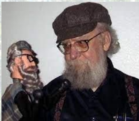
Автор більш ніж 100 оповідань і півтора десятка романів у жанрі фантастики Деймон Найт (США, 1922- 2002)