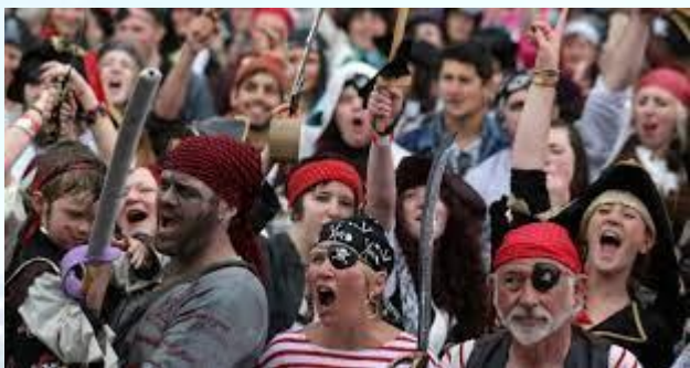
Міжнародний день наслідування піратам