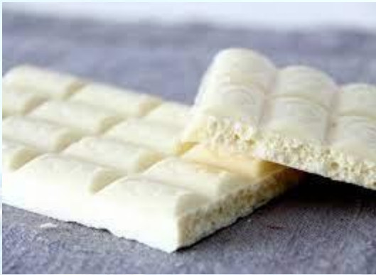
День білого шоколаду