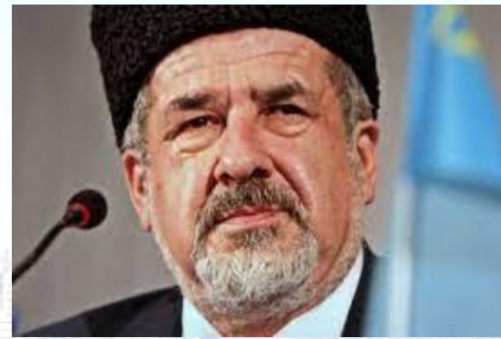
Голова Меджлісу кримськотатарського народу Рефат Чубаров (1957)