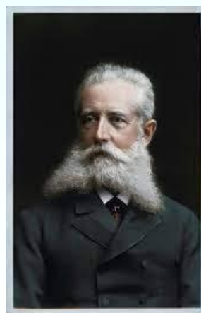
Хірург, один із піонерів асептики. Першим застосував еластичний бинт, наркозну маску, запропонував кружку Есмарха Фрідріх Есмарх (Німеччина, 1823-1908)