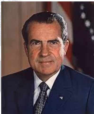
37-ий президент США Річард Ніксон (США, 1913-1994)