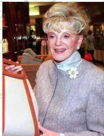
Письменниця, автор бестселлерів Джудіт Кренц (США, 1928-2019)