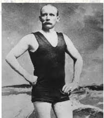
Англієць, який першим переплив Ла-Манш у серпні 1875 року Метью Уебб (1848-1883)