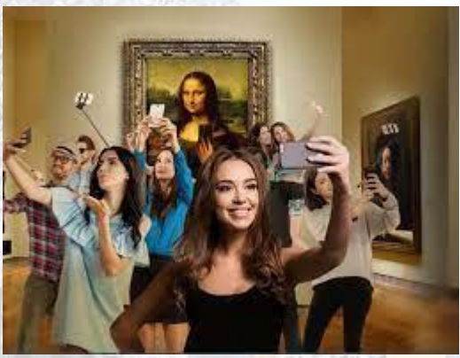
День музейного селфі