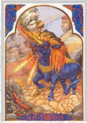
День Інтри - бога джерел, колодязів, змій і хмар (слов.)