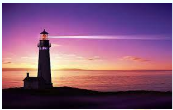
День запалювання маяка