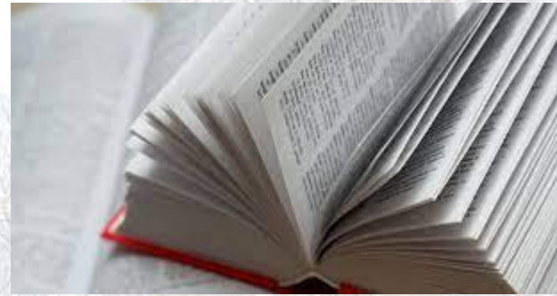
День тлумачного словника