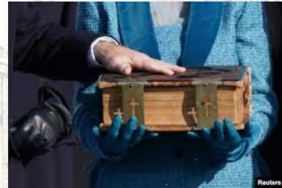
День присяги президента США