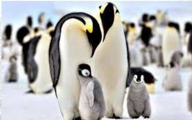
День поширення знань про пінгвінів