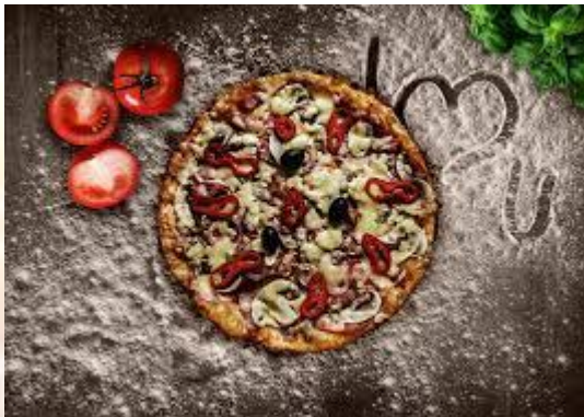
Міжнародний день піци