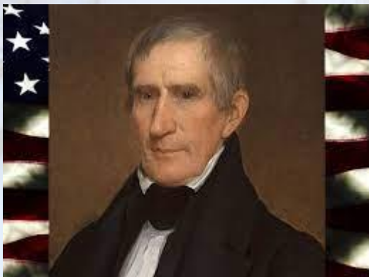
9-й президент США Вільям Генрі Гаррісон (США, 1773-1841)