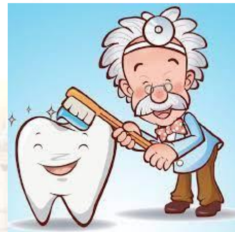
Міжнародний день стоматолога