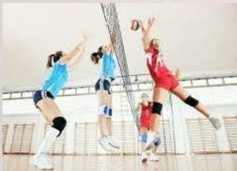
День народження волейболу