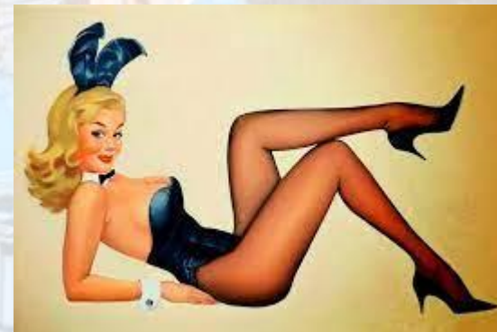
Всесвітній день стриптизу