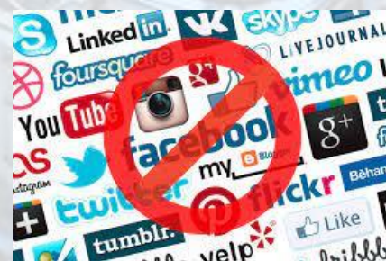
Всесвітній день без Facebook