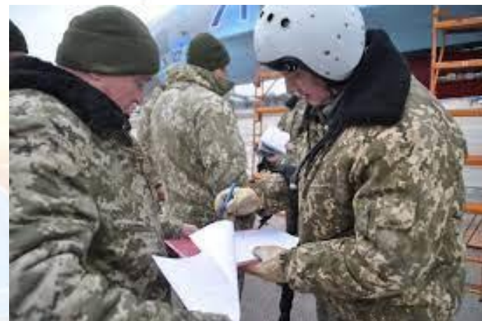
День штурманської служби авіації Збройних Сил