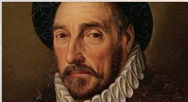
Богослов, філософ, есеїст-мораліст («Досліди»), громадський діяч Мішель де Монтень (Франція, 1533- 1592)