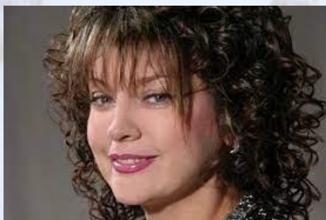
Естрадна співачка Лілія Сандулеса (1858)