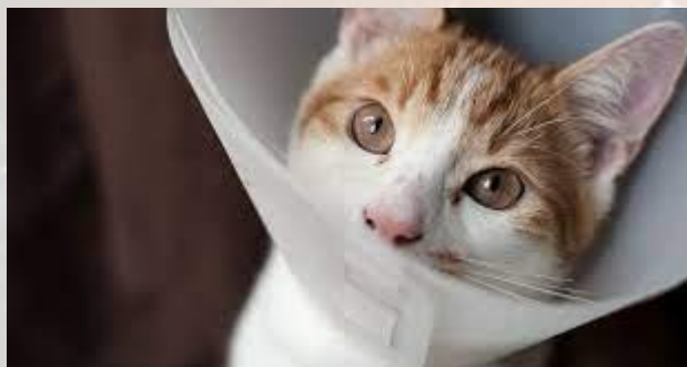
Всесвітній день стерилізації тварин