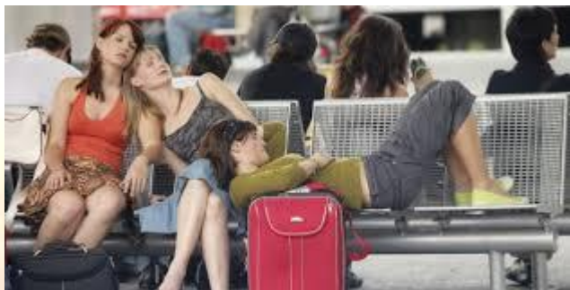
День сну в громадських місцях