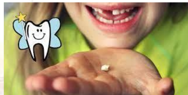
День зубної феї