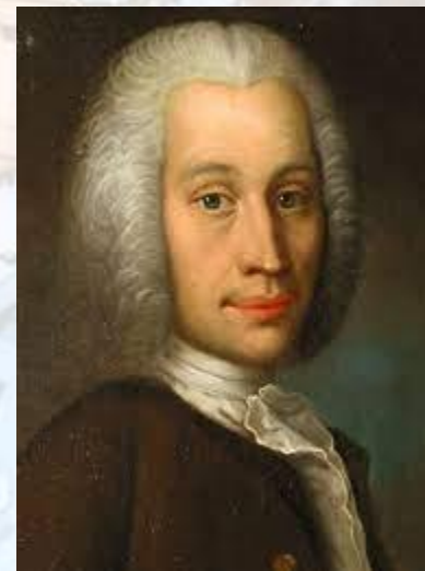
Натураліст, винахідник спиртового термометра та температурної шкали, названої його ім'ям Рене Реомюр (Франція, 1683-1757)